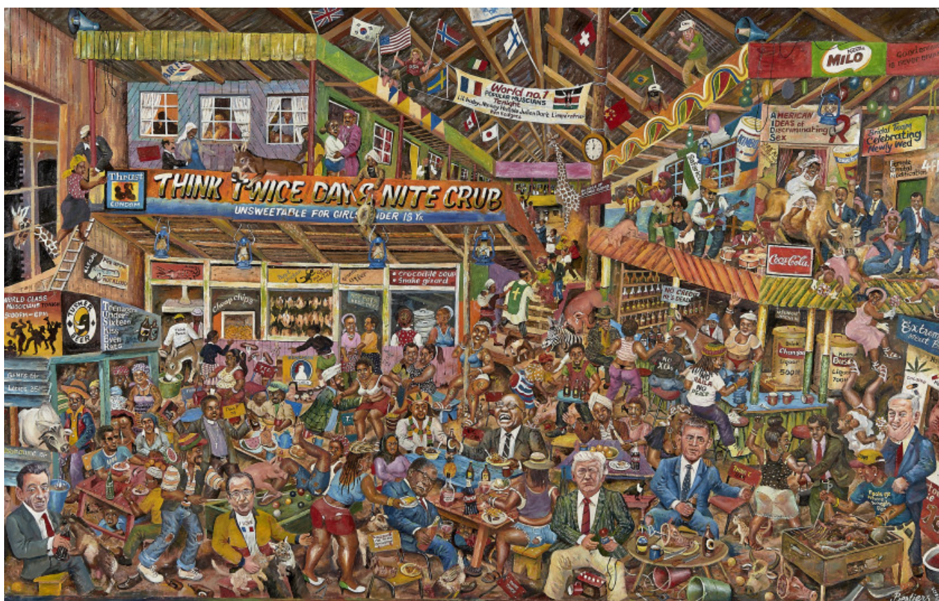
Joseph Bertiers (Quênia), O bar , 2020.

Uma redução nos gastos militares dos EUA liberaria fundos do governo para investir em educação, saúde, infraestrutura e manufatura. No entanto, isso exigiria uma mudança na política externa dos EUA, o que não parece estar no horizonte. Até lá, o povo dos Estados Unidos e de outros países terá que arcar com os custos da nova Guerra Fria de Washington.