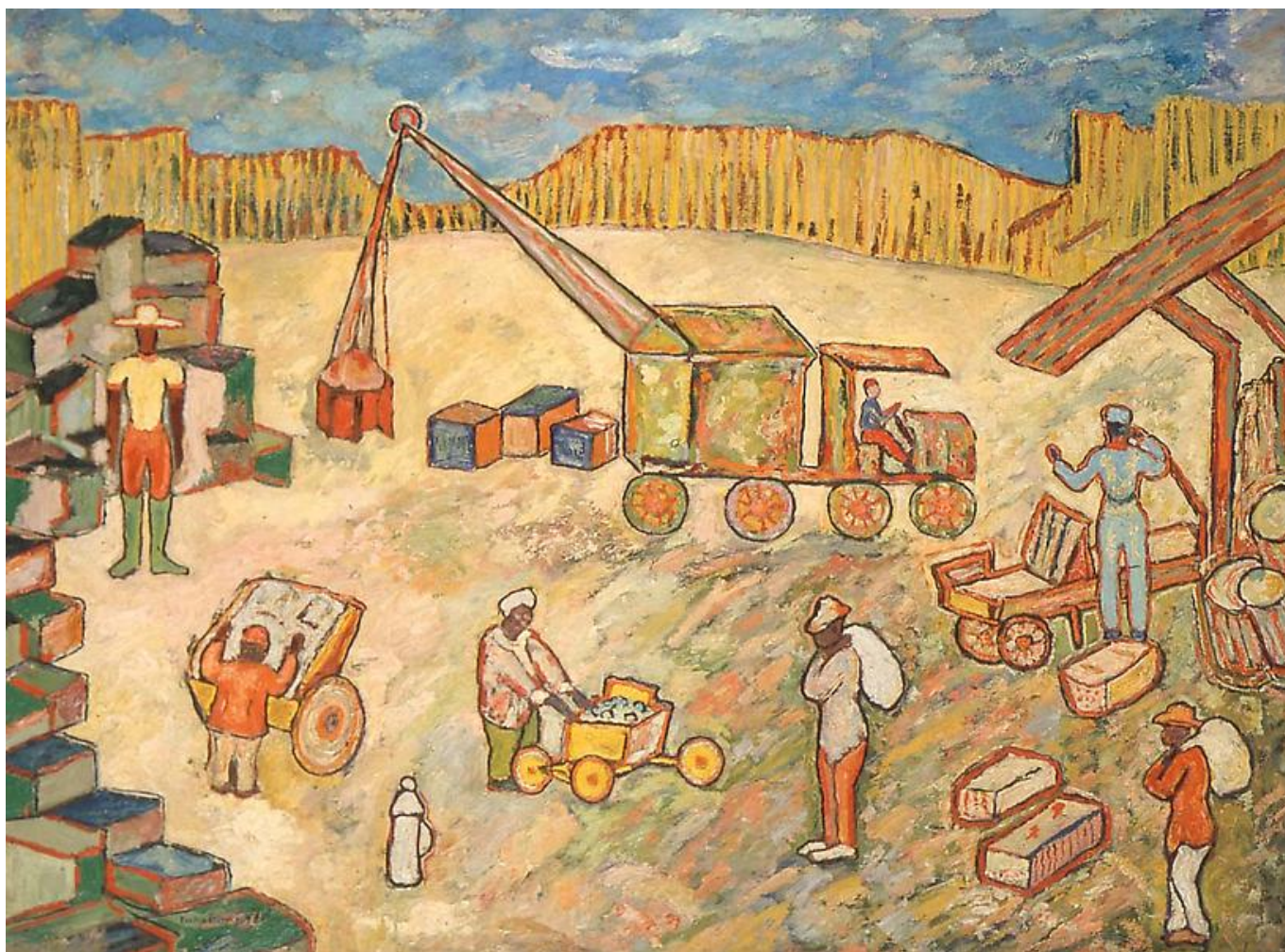
Beauford Delaney (EUA), Local de trocas , 1943.

A plataforma No Cold War , com a qual o Instituto Tricontinental de Pesquisa Social mantém uma estreita relação de trabalho, produziu uma intervenção muito importante nesse debate. O boletim n. 2, Os Estados Unidos desestabilizaram a economia mundial , veiculado abaixo, afirma que um fator determinante na atual crise inflacionária é o impacto desproporcional dos Estados Unidos na economia global; aqui, os gastos militares estadunidenses, a escala dos Estados Unidos no consumo global, o papel do regime de Wall Street-Dólar-FMI e outros fatores desempenham um papel fundamental. Esperamos que você leia e compartilhe o boletim n.2, fazendo-o circular amplamente.