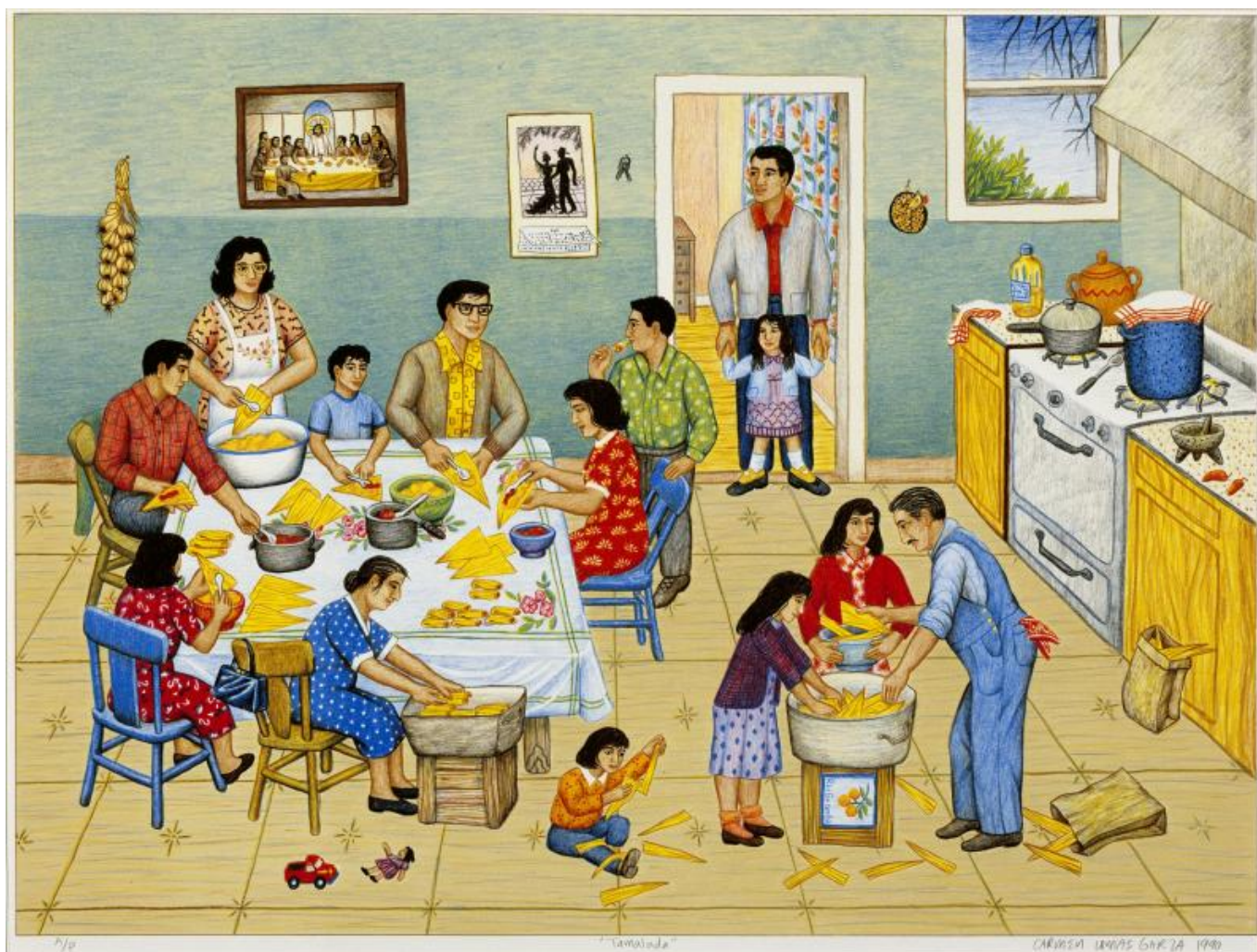
Carmen Lomas Garza (EUA), Tamalada , 1990.