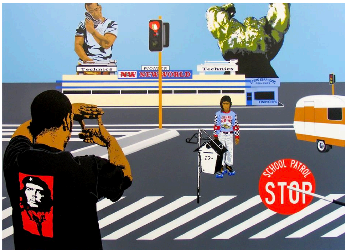
Kelcy Taratoa (Aotearoa), Episode 0010 from the series Who Am I? [Episódio 0010 da série Quem sou eu? ] Episódios, 2004.