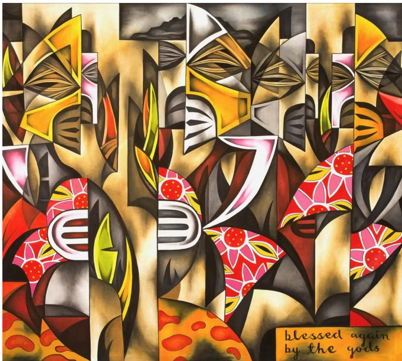
Mahiriki Tangaroa (Kūki 'Airani), Blessed Again by the Gods (Spring) [Abençoado de novo pelos deuses (primavera)], 2015.