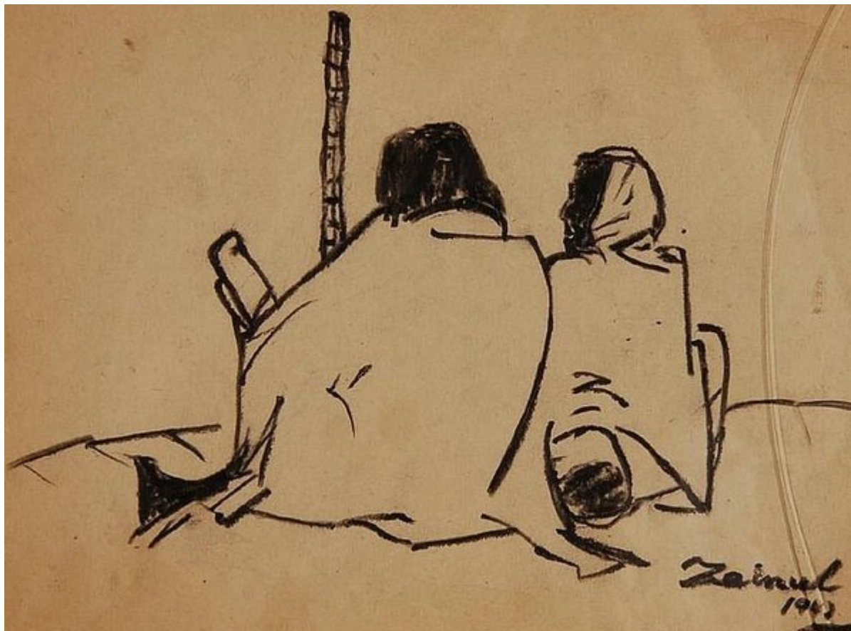
Famine Sketches / Этюды голода, 1943. Zainul Abedin / Зейнул Абедин.

Революции — это не поездка на поезде, а скорее человечество, которое хватается за аварийные тормоза: двадцать девятое письмо