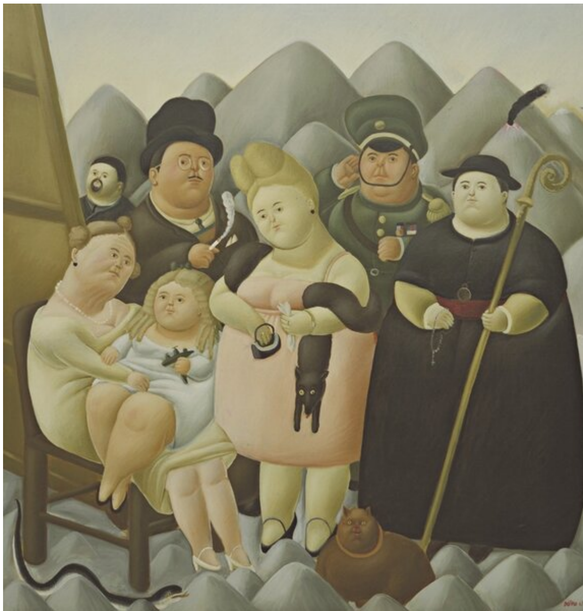
The Presidential Family / Семья президента, 1967. Fernando Botero / Фернандо Ботеро.

Улучшенные политические курсы? На протяжении последних десятилетий, давление учреждений таких, как Международный валютный фонд и Всемирный банк, так же, как и коммерческих банков, сузили возможности государственного вмешательства с целью борьбы с бедностью. Общая теория — это надежда на то, что бедность может быть искоренена через филантропию и благотворительность. Все взоры устремлены на миллиардеров, с надеждой что они пожертвуют свои богатства для того, чтобы искоренить неравенства мира. Но эти жертвования скудны, их влияние не существенно.