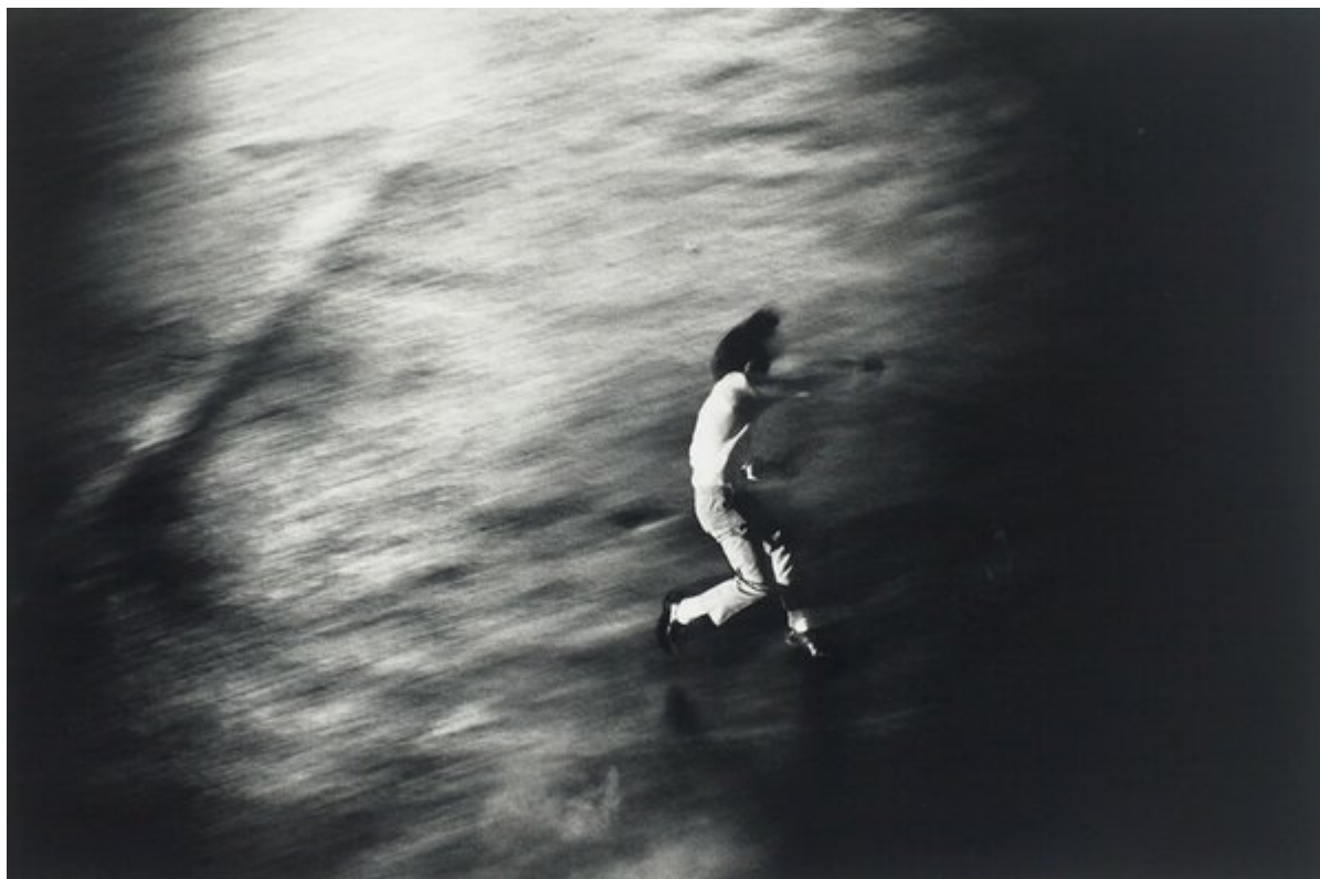
Protest 1, Oh! Shinjuku / Протест 1, О! Шинзюко, 1969. Shomei Tomatsu / Сёмэй Томацу.

Возьмём два бытовых прибора: бездымную печь и морозильник. Бездымная печь необходима для социального развития — это осязаемое и выполнимое решение болезням, вызванным дымовыми печами. Они непропорционально затрагивают женщин, которые полагаются на них, чтобы кормить свои семьи. Тысячи университетских лабораторий создали такие печи. И всё же они отсутствуют во многих домах — от деревень Непала до городов Мексики. Почему? Просто потому, что люди, которые нуждаются в них, лишены покупательской способности, чтобы купить их. Капитал не берет прототип из лаборатории, не развивает его в массовый рыночный продукт и не доставляет его в каждую хижину, в которой сжигается ископаемое топливо без вентиляции. Вместо этого бездымная печь превратилась в эксклюзивный продукт, проект, который развивают неправительственные организации, вместо того, чтобы быть основным правом человека, гарантированным государством с целью защиты человеческой безопасности и защиты от болезней.