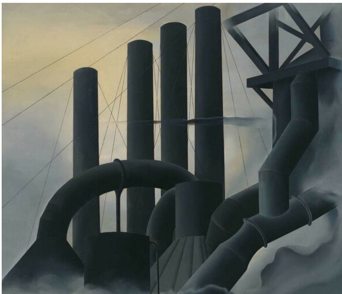
Pittsburg / Питтсбург, 1927. Elsie Driggs / Элси Дриггс.