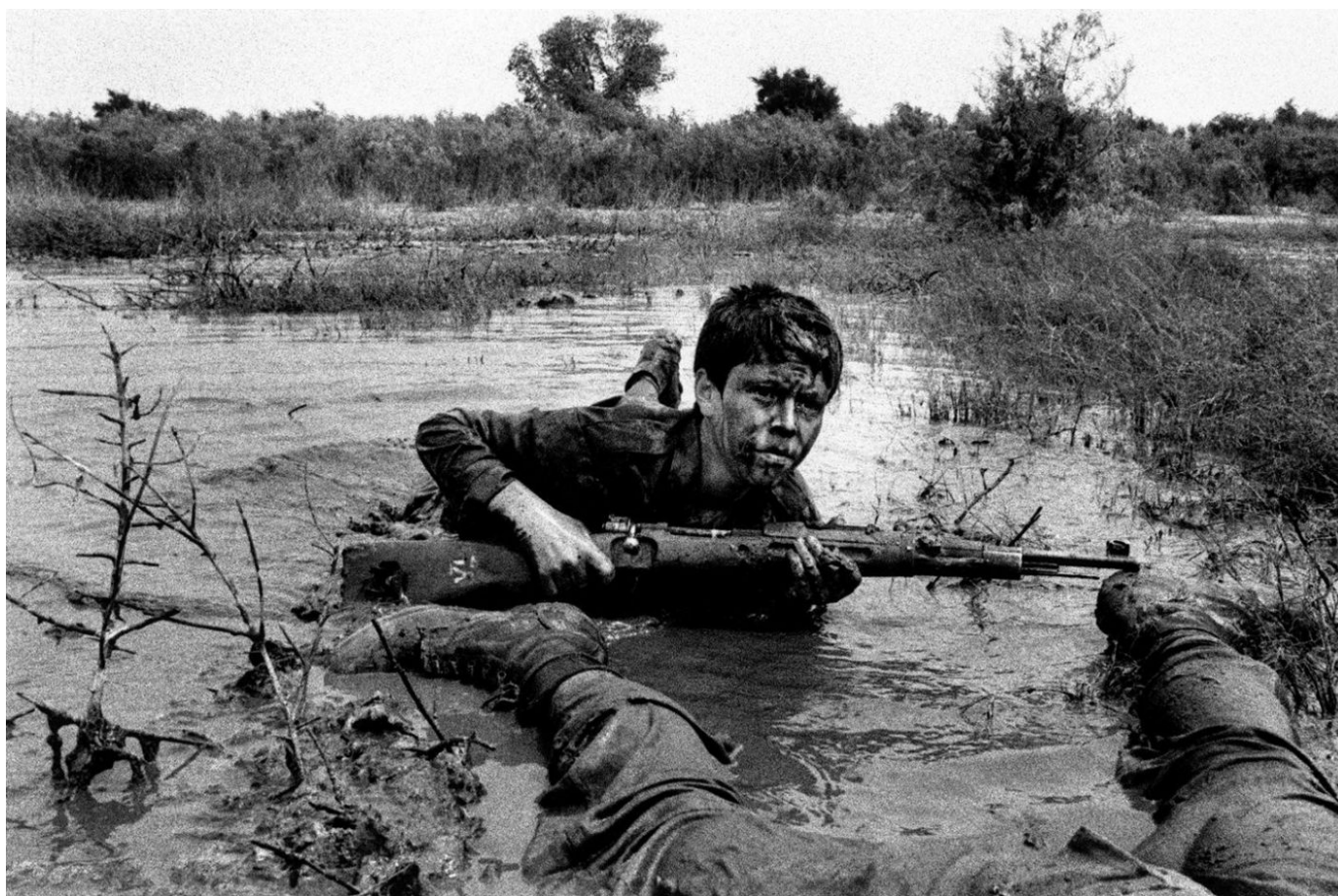
Iran-Iraq War / Ирано-Иракская война (1980-1988).

Тем временем, взгляд из Ирана совсем другой. Иран сталкивается с агрессией Соединенных Штатов на протяжении десятилетий. В 1953, Центральное разведывательное управление (ЦРУ) организовало переворот демократически избранного премьер-министра Мохаммеда Мосаддыка и затем полностью поддержало авторитарную монархию шаха Ирана до тех пор, пока он не был низвергнут народным восстанием 1979. Именно Соединенные Штаты, другие страны Запада и Саудовская Аравия подтолкнули Ирак к вторжению в Иран и ведению ужасной войны на протяжении восьми долгих лет. Две неблагоприятные войны Соединенных Штатов – против Афганистана (2001) и Ирака (2003) – разбили двух давних врагов Ирана – Талибан и партию Баас Саддама Хусейна. США вели эти войны, но именно Иран вышел из них победителем.