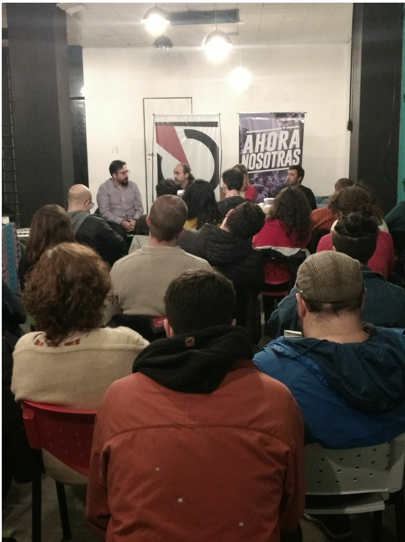
Презентация в Буэнос-Айресе (Аргентина) досье номер 17 о гибридной войне против