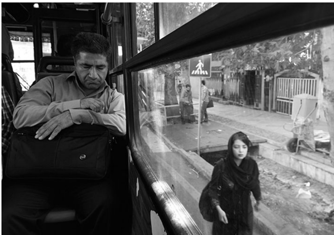
Мужчина задремал в автобусе в час пик на севере Тегерана. Morteza Nikoubazi / Мортеза Никубазл.