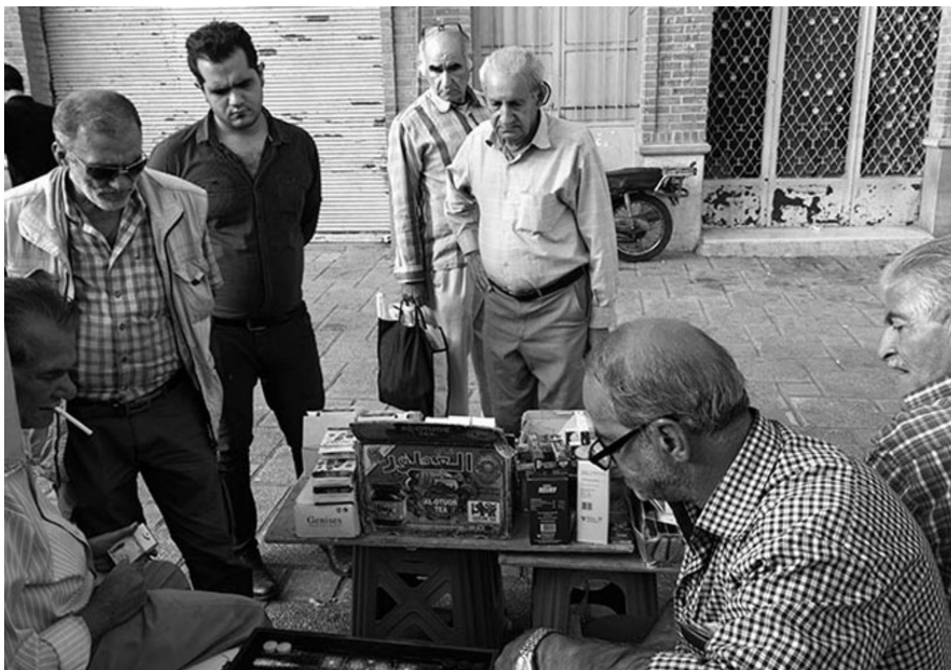
Иранцы играют в нарды на улицах южного Тегерана. Morteza Nikoubazi / Мортеза Никубазл.

Разговоры о провокациях США против Ирана, от диверсий до атак на танкеры, не включают в себя Iran Mission Centre (Иранский центр миссий) ЦРУ, созданная чтобы генерировать «факты», которые позволят США бомбить страну (подробнее об этом Иранском центре миссий, пожалуйста, читайте в моем репортаже ). Этот центр возглавляют люди, которым не терпится начать войну с Ираном, люди, которые пойдут на все чтобы начать эту войну. Предполагать, что они играют по правилам международного законодательства наивно; они презирают эти правила, они насмеваются над ними публично и нарушают их приватно.