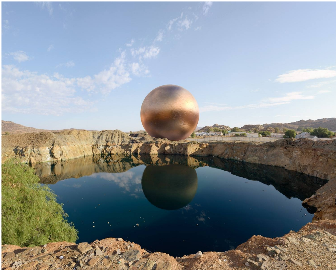
West O'okiep Mine, 284000 tonnes of copper / Западная шахта О'окиеп, 284000 тонн меди, 2014.