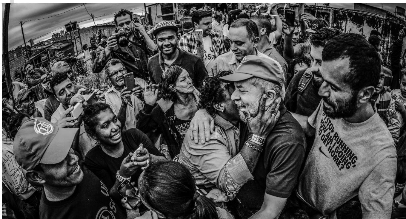
Lula / Лула, 2018.