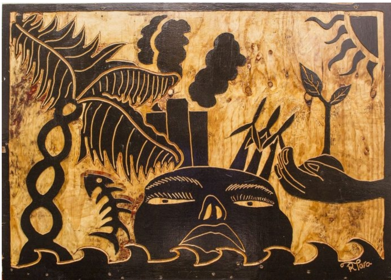
Лаутока Андхра Сангам Колледж, Фиджи, 2018.

На этой неделе ООН провела пять саммитов посвящённых климатической катастрофе. Генеральный секретарь ООН Антониу Гутерриш сказал , что два слова определяют эти пять собраний: амбициозность и действие. Глобальные протесты с целью защитить планету имели место в прошлую пятницу, с большим количеством протестов, запланированных на будущее. Тем не менее, все разговоры в ООН продолжают быть заблокированными отказом Соединенных Штатов и других западных стран признать, что они несут главную ответственность за катастрофу, так как они уже использовали с излишком свою долю углеродного бюджета. Надежда, что эти страны сделают существенный вклад в Глобальный Климатический Фонд, теперь погасла. Минимальная необходимая сумма — это триллионы долларов США, а не жалкие миллиарды, которые были обещаны. Мало говорится о предотвращении изменения климата, о трансфере технологий, о неравенстве объёмов эмиссий или других существенных решениях, которые бы адресовали корни причин настоящего климатического кризиса.