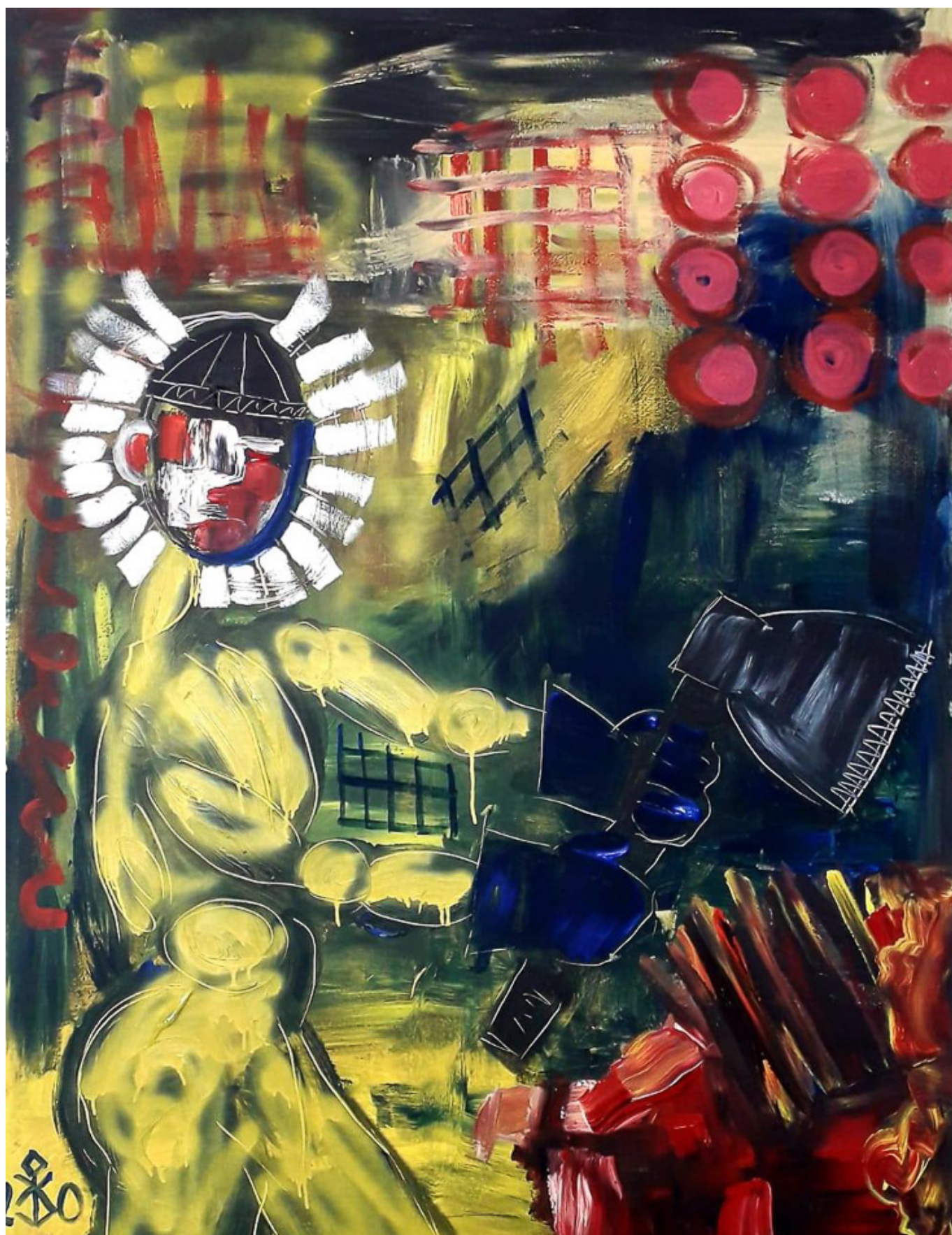
Coronavirus / Коронавирус, 2020. Kanat Bukezhanov / Канат Букежанов.