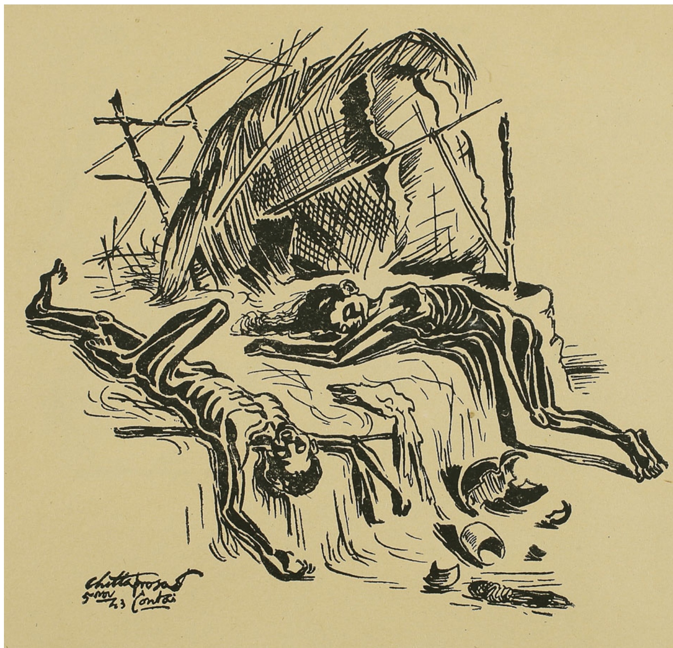
Hungry Bengal / Голодный Бенгал, 1943. Chittaprosad / Читтапросад.