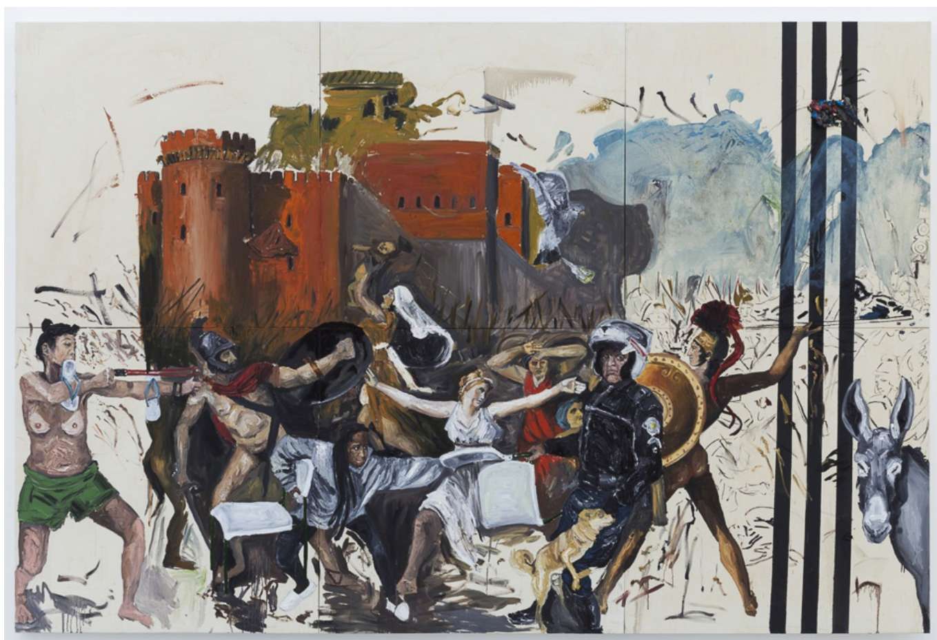
Оcupar e resistir 1 / Оккупируй и сопротивляйся 1, Бразилия, 2017. Camila Soato / Камила Соато.

число инфицированных, а число смертей продолжает расти. По-видимому, в настоящее время в Бразилии инфицировано около миллиона человек (население страны 211 миллионов). В Индии трудно даже оценить число инфицированных, поскольку уровень тестирования очень низок, а данные очень скудны. Одно из предположений состоит в том, что по меньшей мере восемь миллионов человек были инфицированы (население страны 1,3 миллиарда).