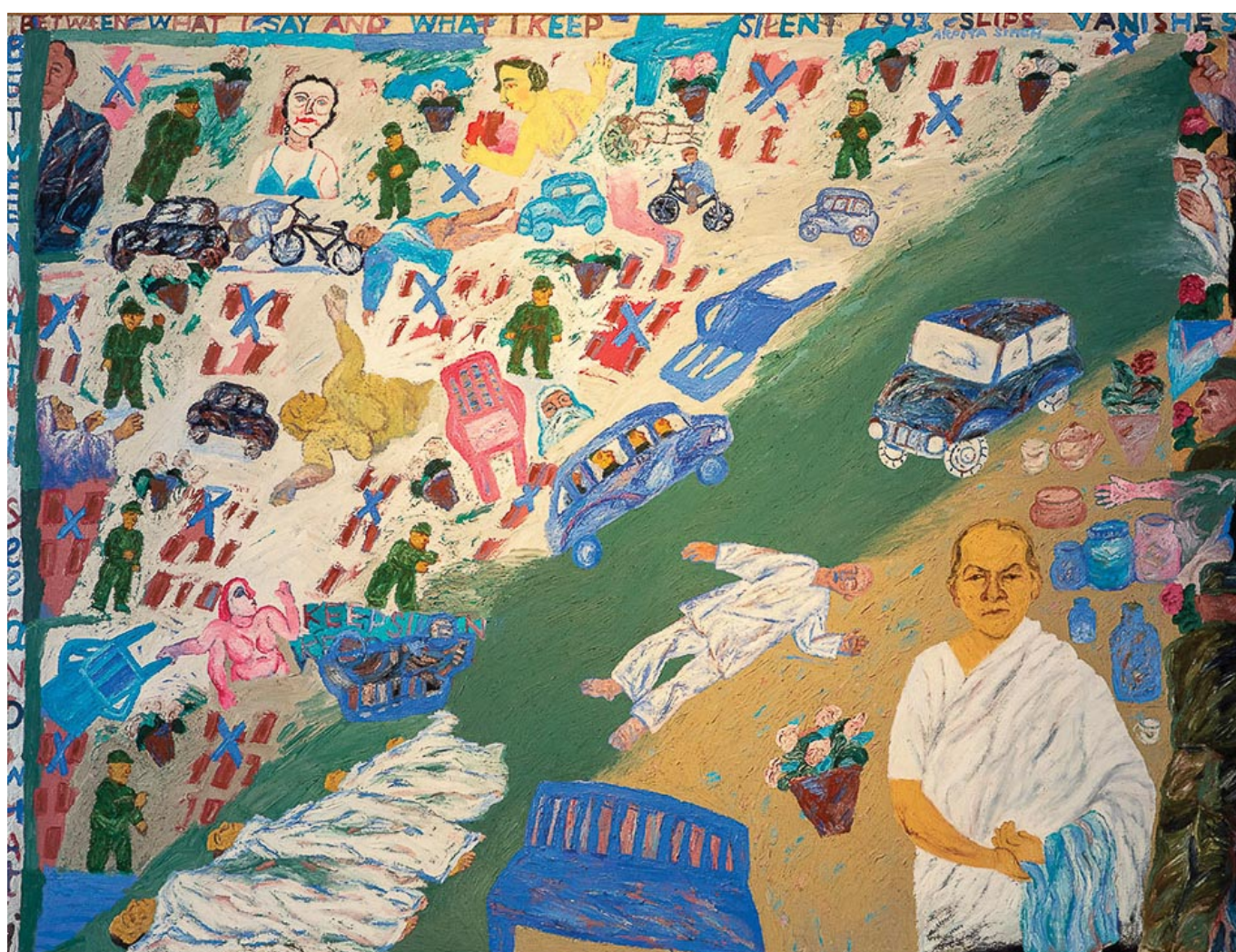
My Mother / Моя Мать, Индия, 1993. Arpita Singh / Арпита Сингх.