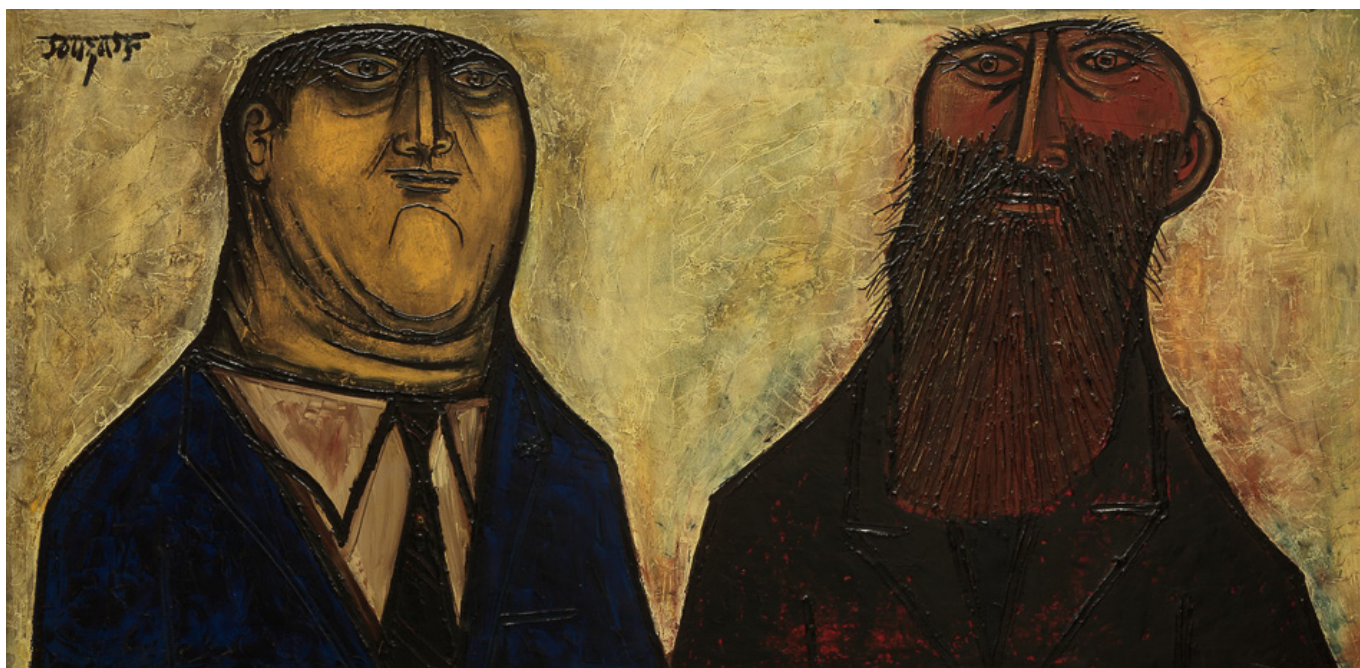
Tycoon and the Tramp / Магнат и Бродяга, Индия, 1956. FN Souza / ФН Соуза.

Пренебрежение к людям свидетельствует об опасной некомпетентности правительств Жаира Болсонару и Нарендры Моди. Бесцеремонное отношение Болсонару к чрезвычайно контагиозной природе вируса означало, что не было хорошо продуманного режима самоизоляции в стране; когда Болсонару начал кампанию по полному открытию страны, мэр Сан-Паулу, Бруно Ковас, обвинил Болсонару в игре в “русскую рулетку” с населением.