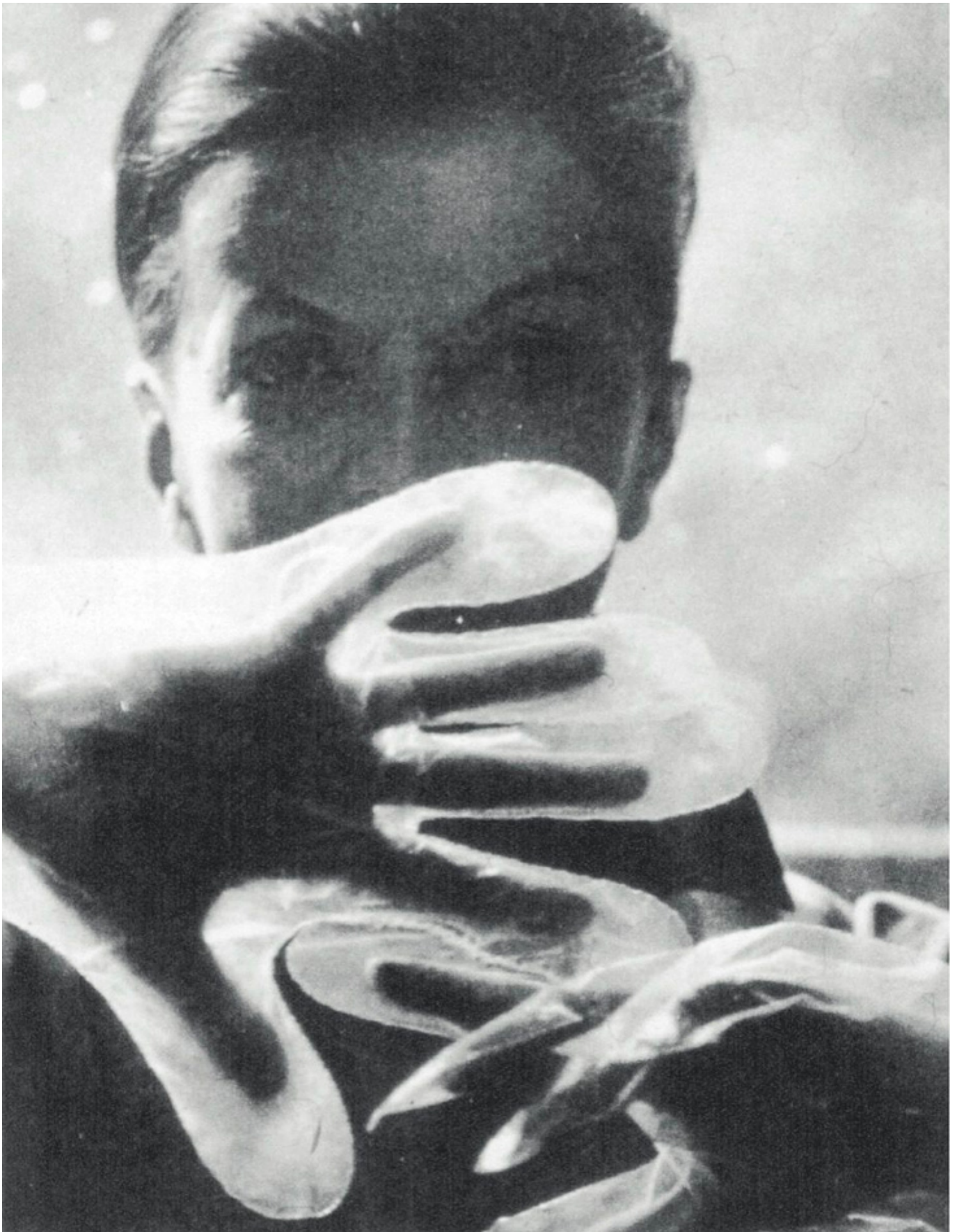
Nostalgia do corpo / Ностальгия по телу, Бразилия, 1964. Lygia Clark / Лигия Кларк.