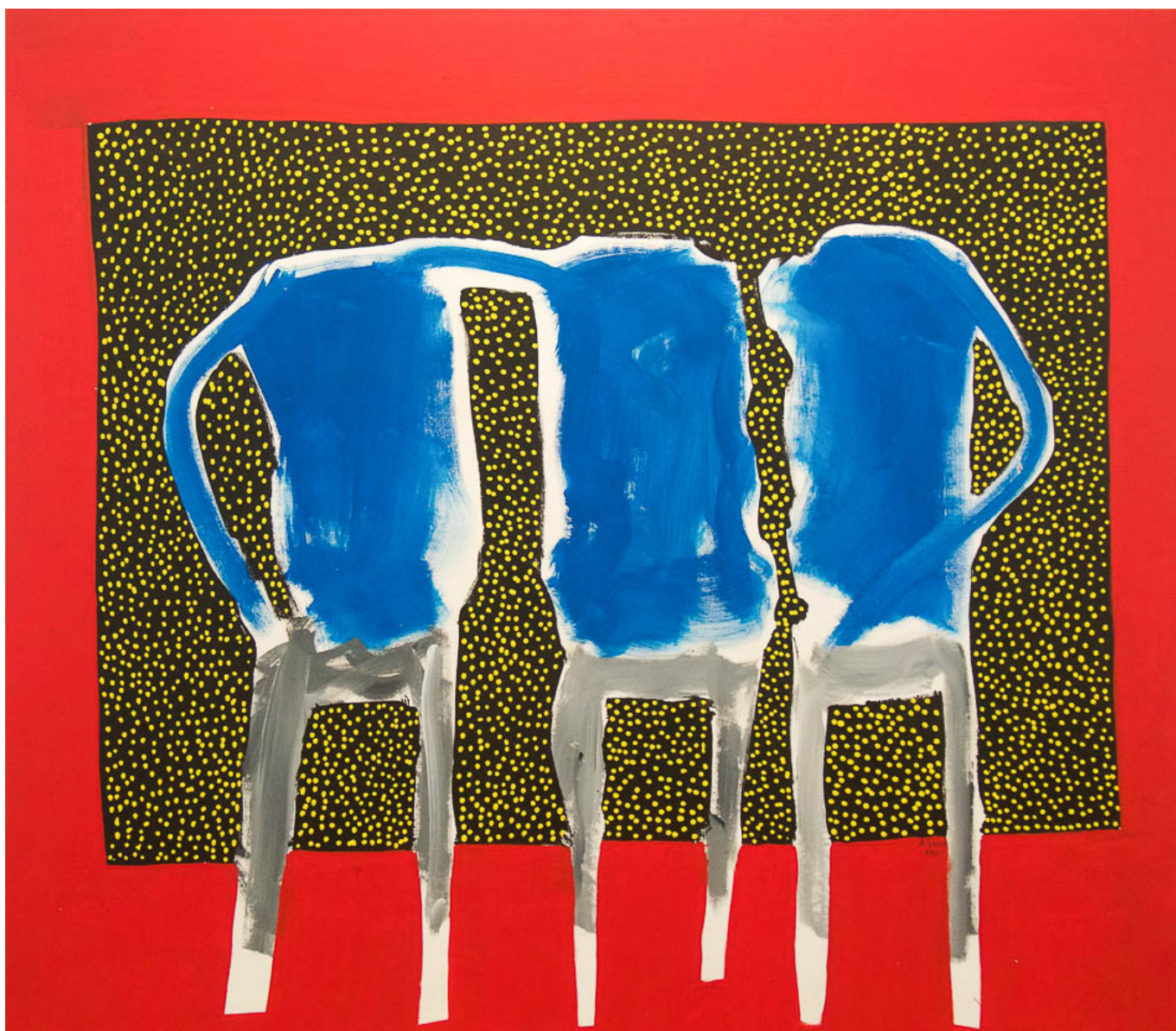
Амаду Саного (Мали), Sans-Tete / Без Головы , 2016.