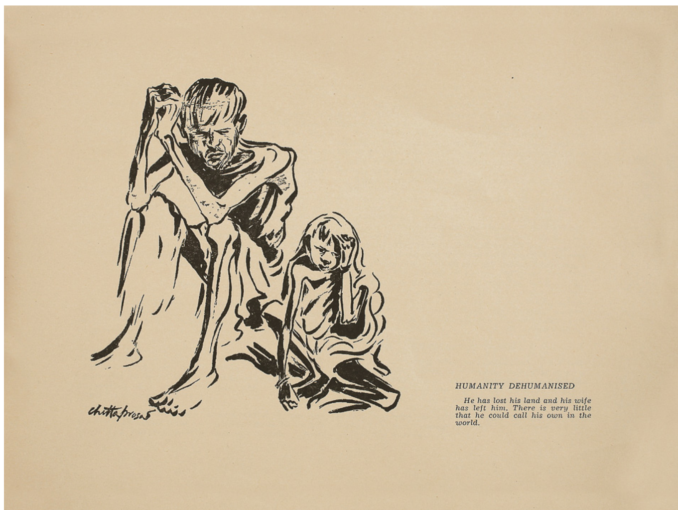
Читтапросад, Голодная Бенгалия, 1945.

В июле 1921 года Коммунистический Интернационал сформулировал правила и рекомендации для коммунистов всего мира. Большинство из этих правил просты. Но особенно выделяется одно утверждение: “Для коммунистической партии нет такого времени, когда партийная организация не могла бы быть политически активной”. Этот совет пригодился семьдесят лет спустя, когда распался СССР и мировое коммунистическое движение сильно пострадало от его гибели. История, как утверждалось, закончилась: капитализм доказал, что он теперь вечен и не может быть преодолён.