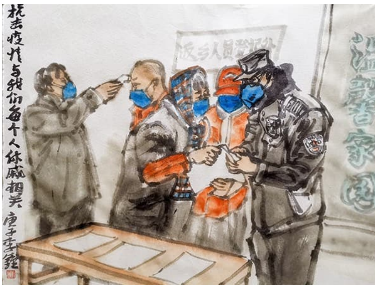
Paintings for Wuhan / Рисунки для Уханя, Китай, 2020. Li Zhong / Ли Чжун.

Без сомнения, коронавирус — это очень серьёзно, и его распространение, безусловно, является следствием его собственной опасности для человеческого организма; но здесь есть и социальные вопросы, которые требуют серьезного осмысления. Ключевой темой любой дискуссии должен быть явный крах государственных институтов в большинстве капиталистических стран, где эти институты были приватизированы, и где частные институты действовали в целях минимизации издержек и максимизации прибыли.