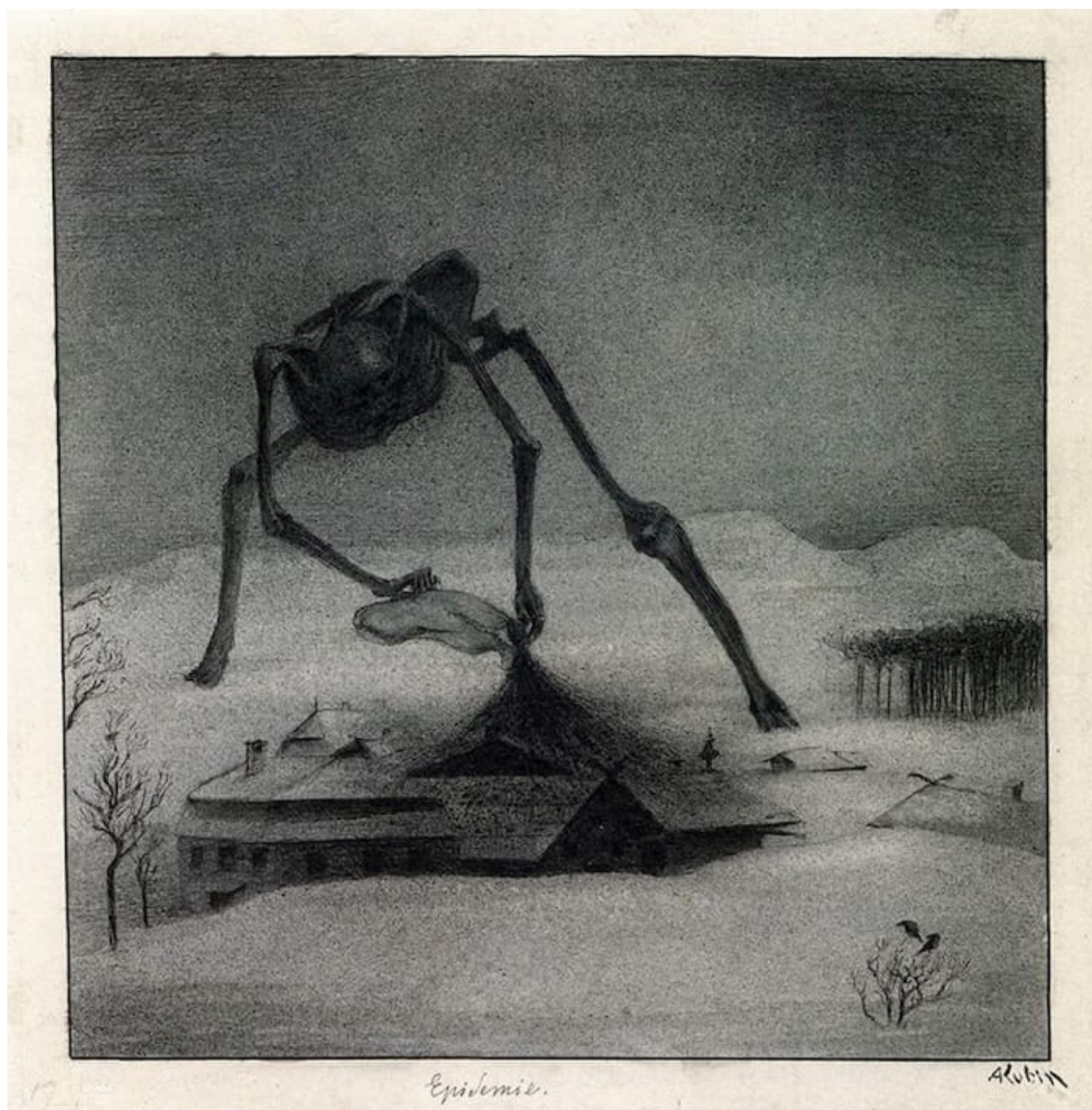
Epidemic / Эпидемия, Австрия, 1900-1901, Городская галерея в доме Ленбаха. Alfred Kubin / Альфред Кубин.

Коронавирус только начал свое наступление на Индию, чья система общественного здравоохранения на протяжении десятилетий подрывалась политикой жесткой экономии, продвигаемой неолиберализмом. Индийский штат Керала (население 35 миллионов человек), который управляется Левым Демократическим Фронтом ( Left Democratic Front ), находится в самом разгаре масштабной кампании по борьбе с коронавирусом, как я и