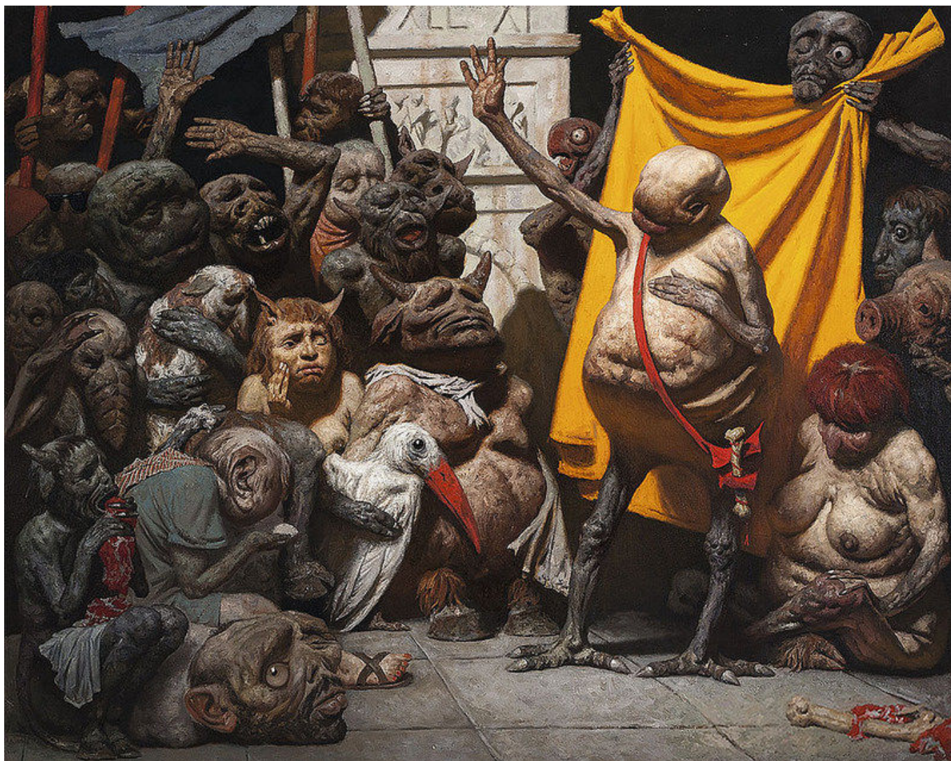
Мутанты, 1990-93. Гелий Михайлович Коржев.

ухудшилось, а общее благосостояние пришло в упадок. Яркие огни фастфудов и торговых центров вошли в их общество, но вместе с ними пришли унижения нищеты и ухудшения здоровья, с глубоким чувством отчуждения и социальной тревоги.