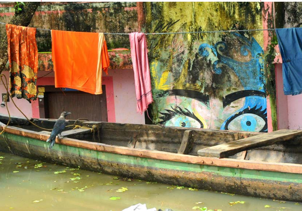
Imagen de la inundación en Kuttanad