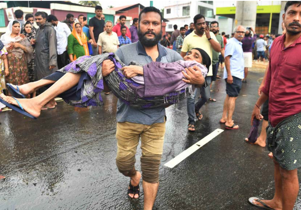
Rescate de una mujer anciana de una casa inundada en Companyppady, Aluva