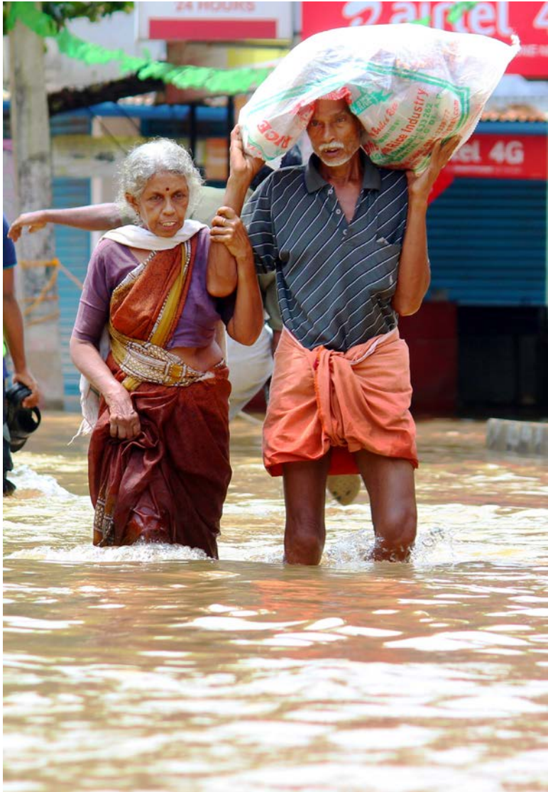
Operaciones de rescate en el norte de Paravur