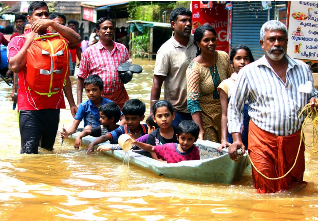
Operaciones de rescate en el norte de Paravur, distrito de Ernakulam