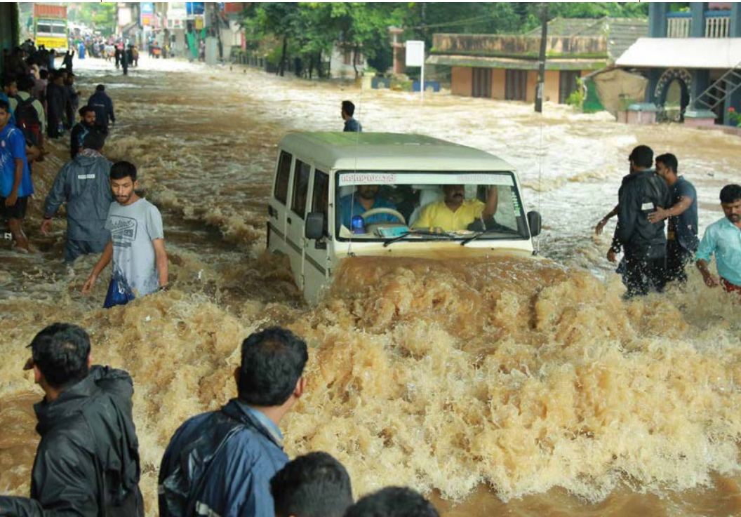
Frente a la estación del metro en Companypaddy, Aluva, distrito de Ernakulam