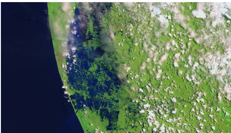
Las regiones costeras del centro-sur de Kerala antes (6 de febrero) y después (22 de agosto) de las inundaciones. Imágenes de los satélites Landsat 8 (NASA/USGS) y Sentinel-2 (Agencia Espacial Europea) Wikimedia Commons