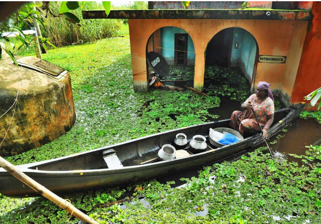
Mujer transportando enseres de su casa inundada en Kainakari panchayat, Kuttanad