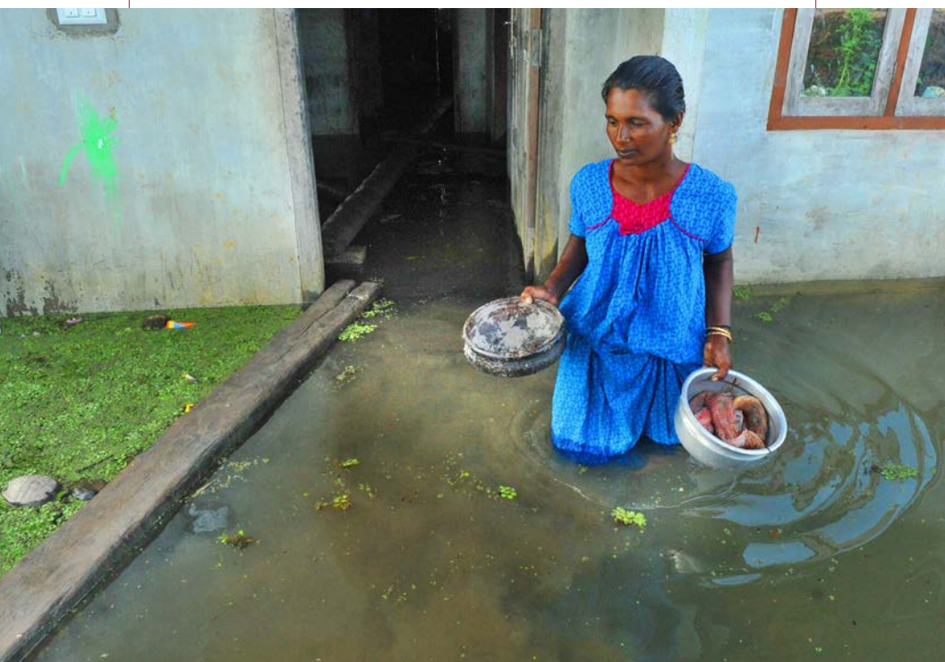
Casa inundada en Kainakari panchayat, Kuttanad