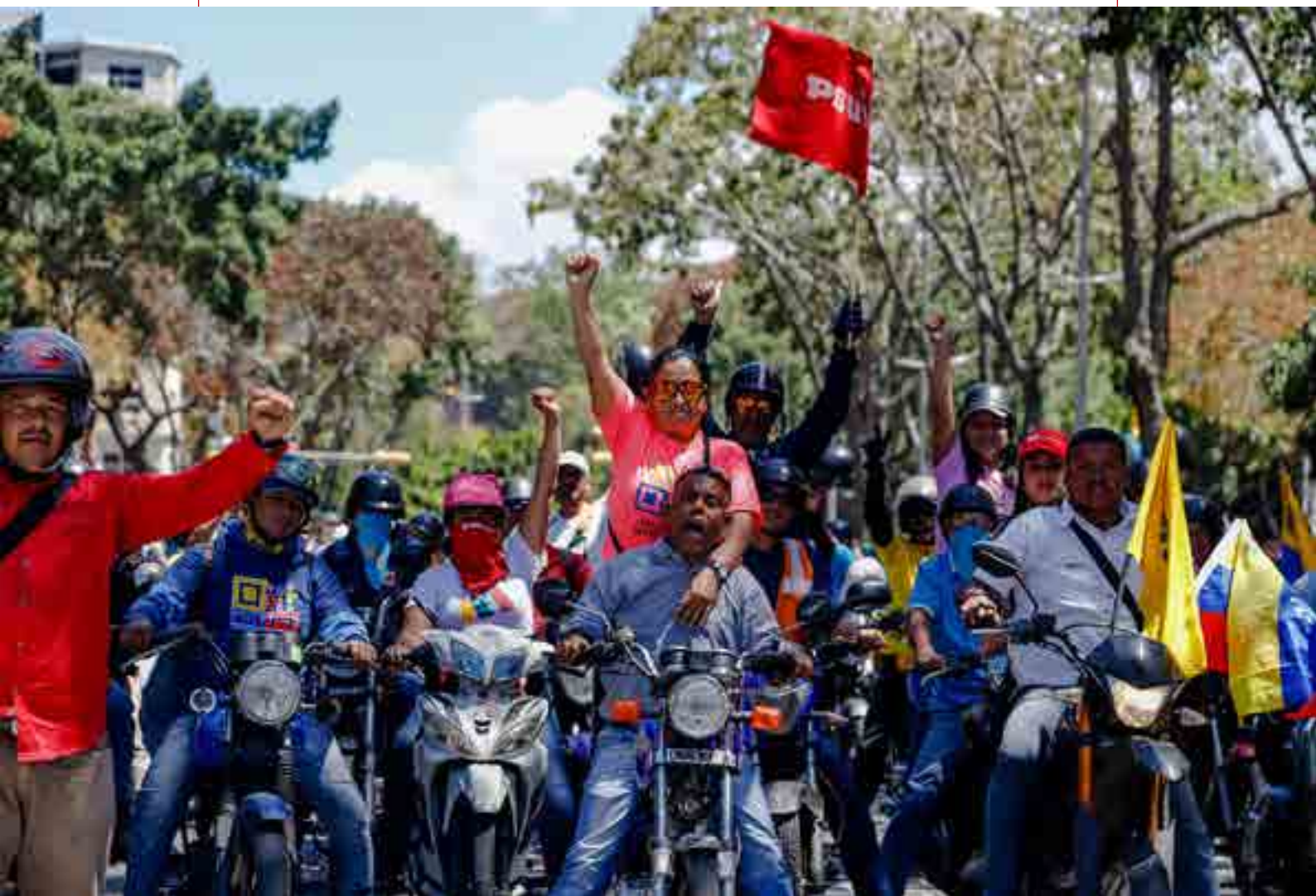
2019年2月24日，委内瑞拉。