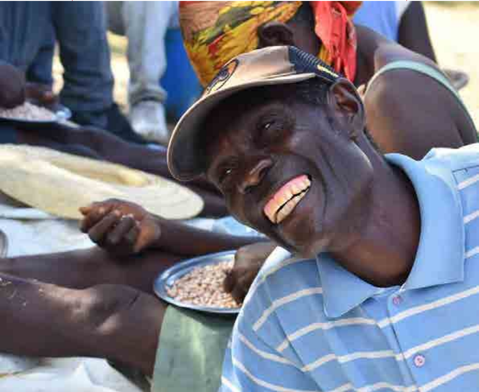
2018, 海地。