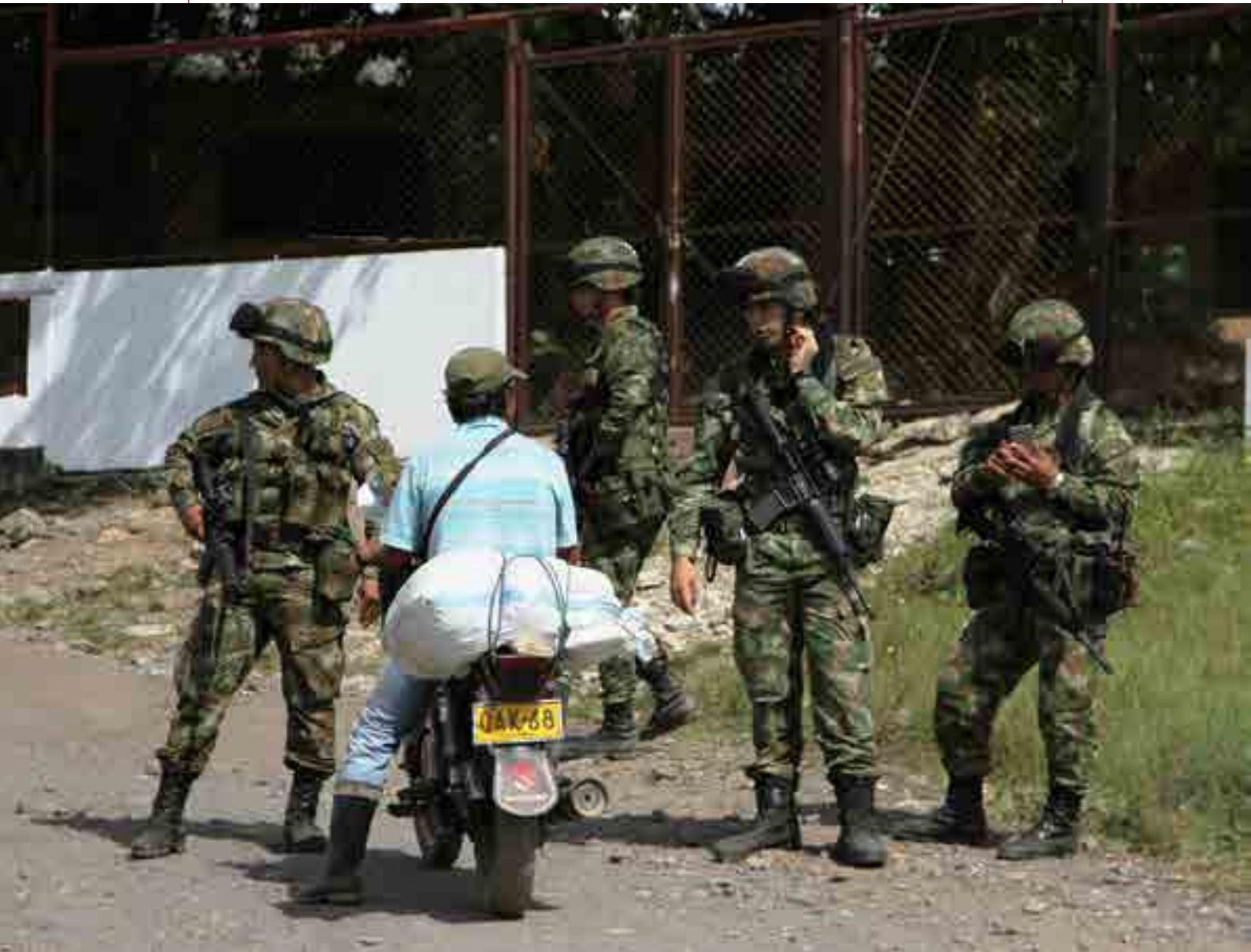
伦比亚卡塔通博地区北桑坦德省菲洛格林戈村。