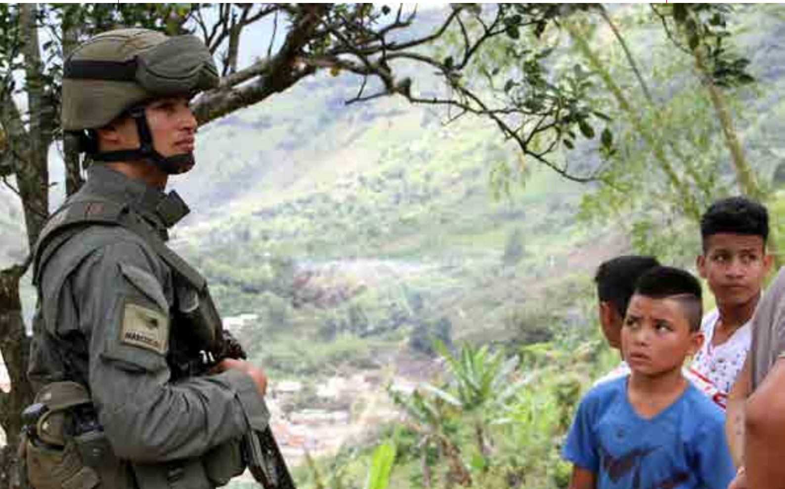
哥伦比亚考卡省阿尔杰里亚镇的埃尔曼果村。