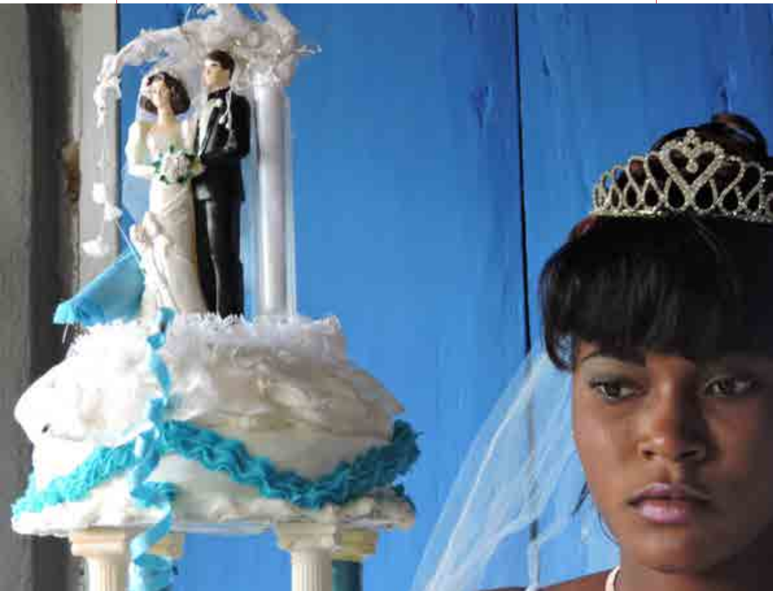
2019年，海地婚礼。