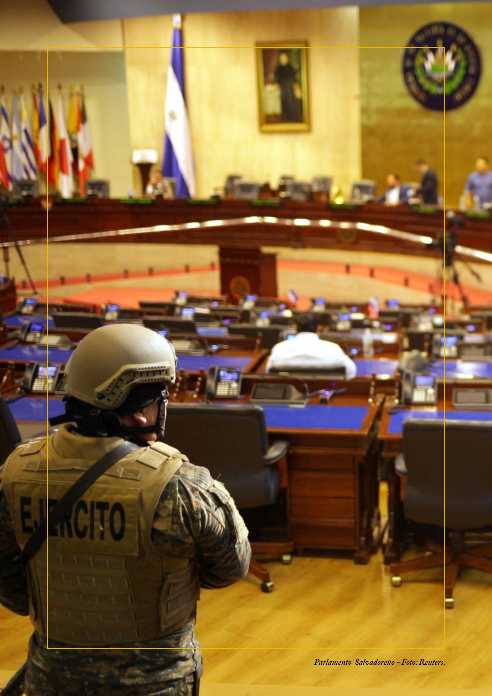
Parlamento Salvadoreño