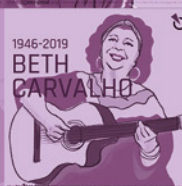
1946-2019 BETH CARVALHO