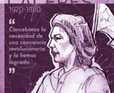
1920-1990 "Concebimos la necesidad de una conciencia revolucionaria y la hemos logrado." "