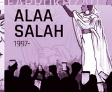
1997- ALAA SALAH