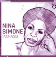
NINA SIMONE 1933-2003