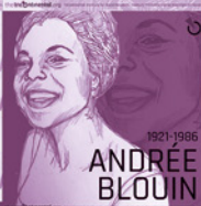
1921-1986 ANDRÉE BLOUIN