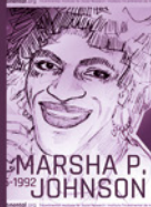
MARSHA P. JOHNSON 1952-