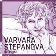
VARVARA STEPANOVA 1894-1958