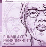
FUNMILAYO RANSOME-KUTI 1900-1978