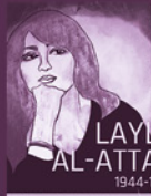
LAYLA AL-ATTA 1944-