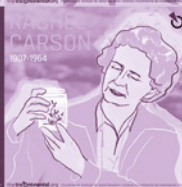
RACHEL CARSON 1907-1964