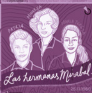
PATRICIA, MARILENE, TERESA Las hermanas Mirabal ca. 1918-1961