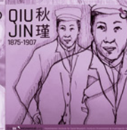
QIU 秋 JIN 瑾 1875-1907