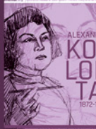
ALEXANI KOLUTA 1872-