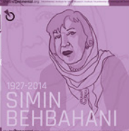
1927-2014 SIMIN BEHBAHANI