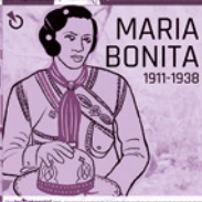
MARIA BONITA 1911-1938