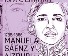
1795-1856 MANUELA SÁENZ Y AIZPIRI