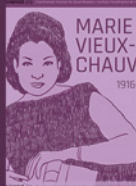
MARIE VIEUX-CHAUVIN 1916-