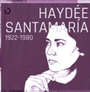
HAYDÉE SANTAMARÍA 1922-1980