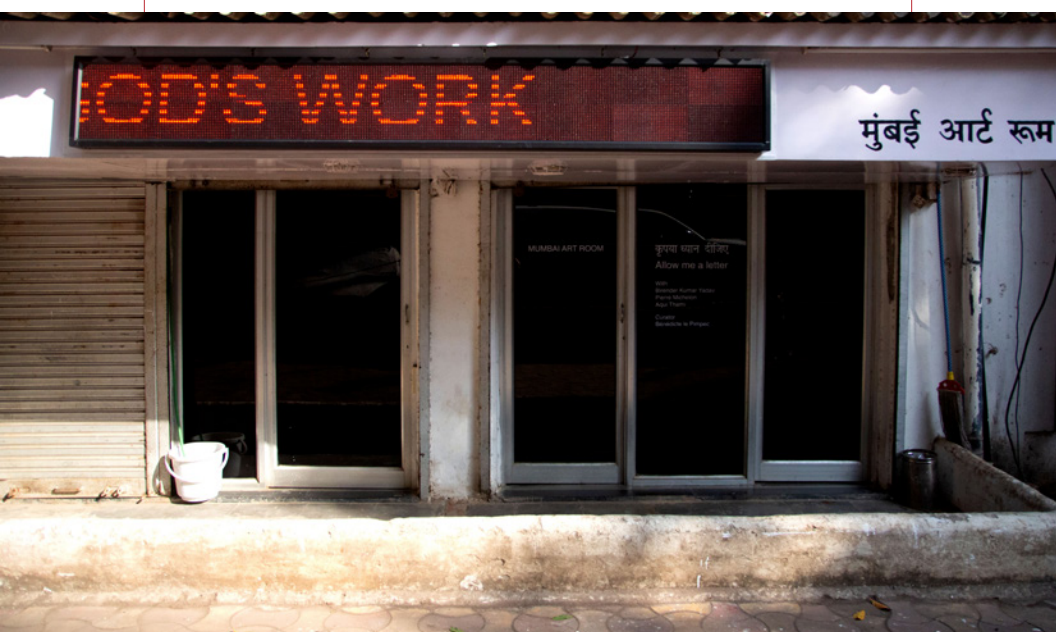
Birender Kumar Yadav, Government Work Is God's Work [O trabalho do governo é trabalho de Deus], 2017. Instalação de luz LED projetada na entrada do Mumbai Art Room.