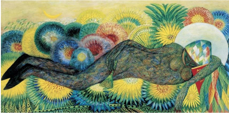
زن رستنی، ماریو آبرئو، ونزوئلا، ۱۹۵۴

البته، مرز باریکی هست بین آزار و اذیت مخالفان سیاسی و رد صلاحیت کسانی که می‌خواهند کشورشان توسط یک قدرت خارجی، «پلیس جهان» مورد تهاجم قرار گیرد. درست است که دولت‌ها اغلب مخالفان خود را با این انگ که آن‌ها عامل یک قدرت خارجی هستند، بی‌اعتبار می‌کنند (همان کاری که سناتور آمریکایی نانسی پلوسی اخیراً با کسانی در ایالات متحده کرد که به نسل‌کشی اسرائیل علیه فلسطینی‌ها اعتراض می‌کنند؛ او آن‌ها را عوامل روسیه خواند و از اداره تحقیقات فدرال خواست در مورد آن‌ها تجسس دقیق صورت دهد). اما ماچادو، آشکارا از ایالات متحده خواسته است به ونزوئلا حمله کند، که در هیچ کشوری با چنین کسی مدارا نمی‌شود.