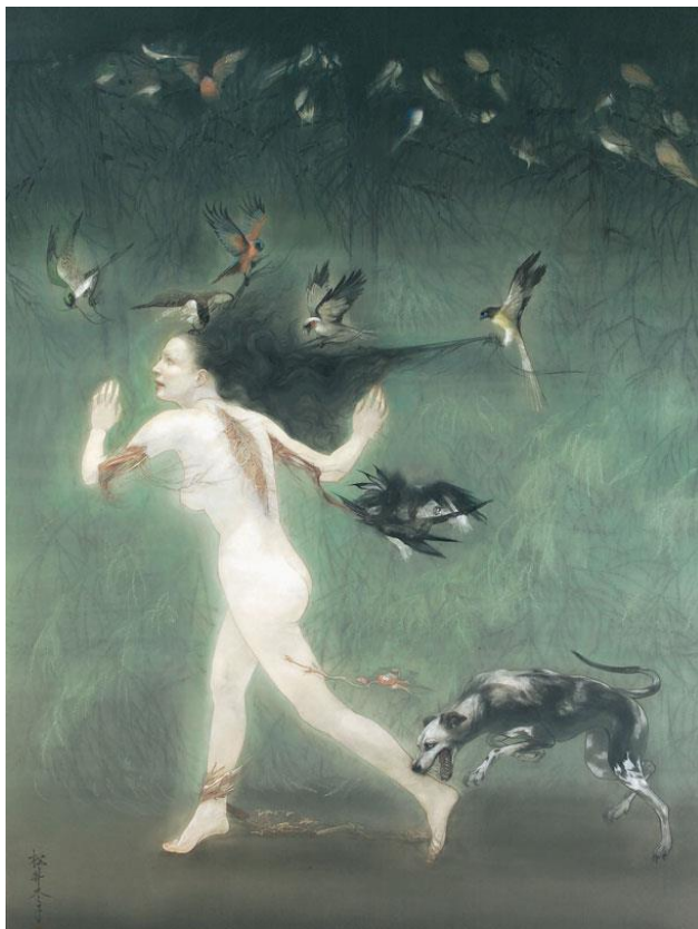
دژدیسیگی های پراکنده در غایت خود، فوکویو ماتسوی، ژاپن، ۲۰۰۷