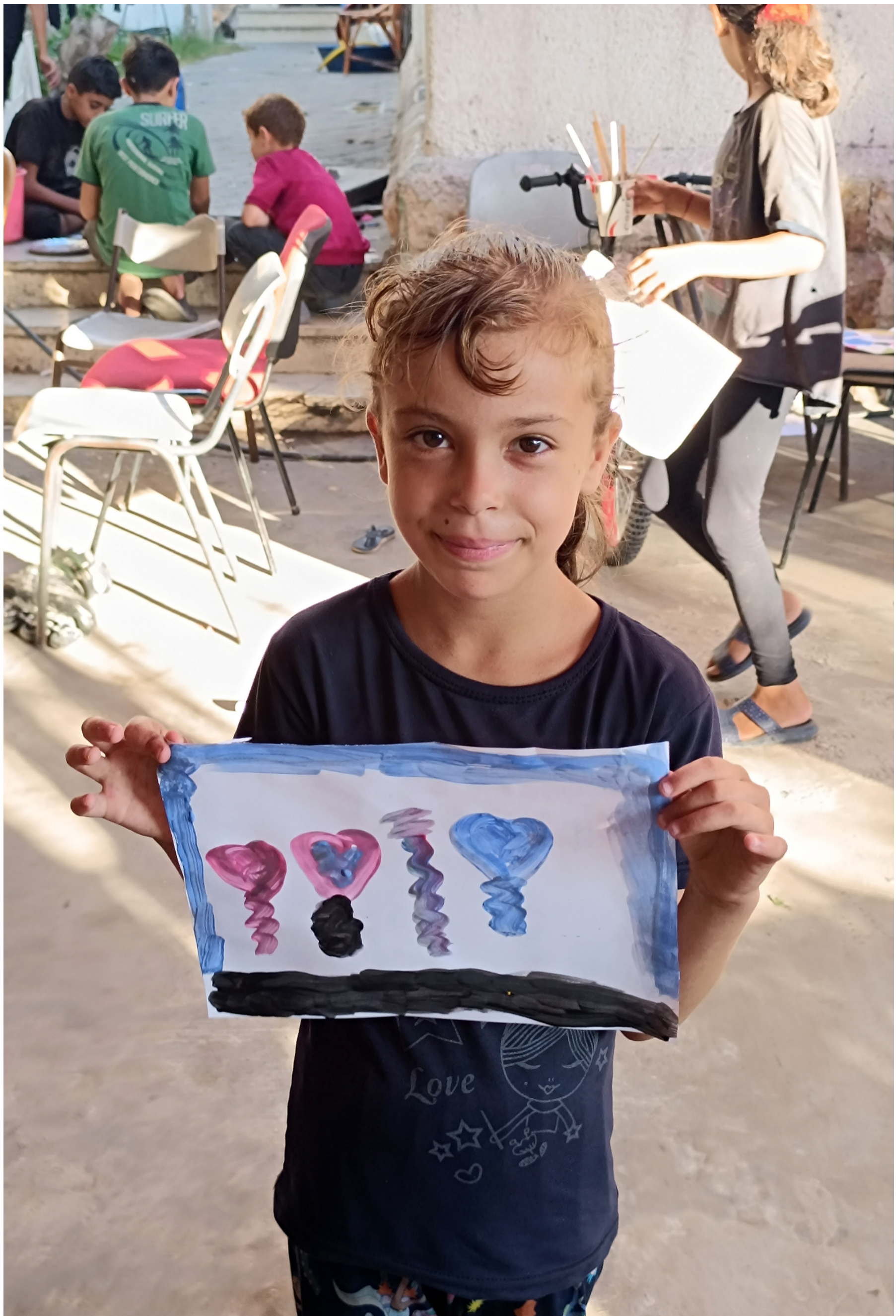
Nombre desconocido (Gaza, Palestina), Sin título , 2024. Evacuó con su familia en octubre de 2024.