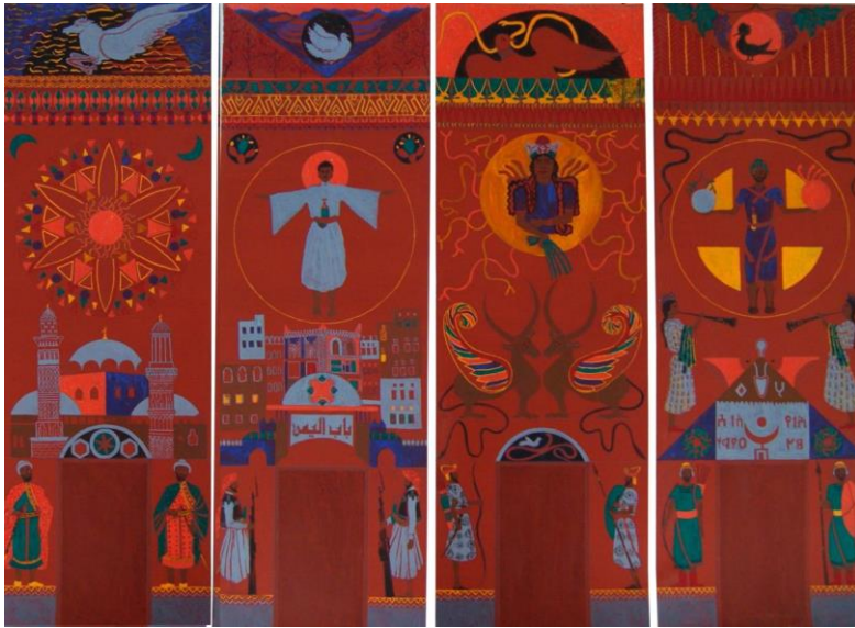
حکیم العاقل (یمن)، تاریخ نمادین بهجت عرب، ۱۹۹۴

پس از شکست نیروهای سوری، ایرانی و روس در سال ۲۰۱۴، شورشیان سوری در شهر ادلب، نه‌چندان دور از مرز ترکیه با سوریه، دوباره گرد هم آمدند. آنجا بود که نیروی اصلی معارض در سال ۲۰۱۶ از القاعده جدا شد، شوراهای محلی را به دست گرفت و خود را به‌عنوان تنها رهبر کارزار ضد اسد شکل داد. این گروه، هیئت تحریر الشام، اکنون در دمشق قدرت را در دست دارد.