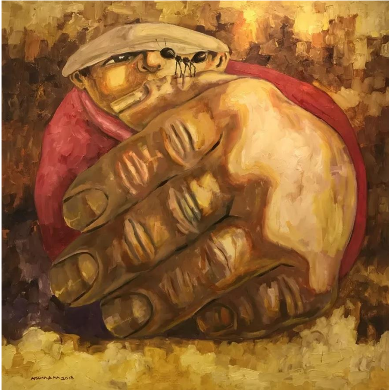
همام السید (سوریه)، مور، ۲۰۱۲