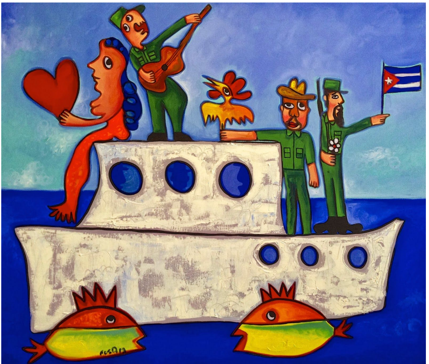
《格拉玛号》 何塞·罗德里格斯·福斯特（古巴）作于2013年

在这次党代会上，劳尔·卡斯特罗卸任了。劳尔是古巴革命元勋之一，曾因在1953年蒙卡达起义中的作用遭到监禁。被释放后，他与哥哥菲德尔一同前往墨西哥，后来乘坐格拉玛号游艇回古巴领导反对美国扶持的独裁者福尔根西奥·巴蒂斯塔的斗争。革命胜利后，劳尔在政府任职，并在古巴共产党内担任领导职务，与菲德尔等人一起领导党度过了艰难的“特殊时期”（1991年至2000年），在2016年菲德尔逝世后又继续领导党。他对于捍卫和完善古巴革命成果的默默奉献是巨大的。