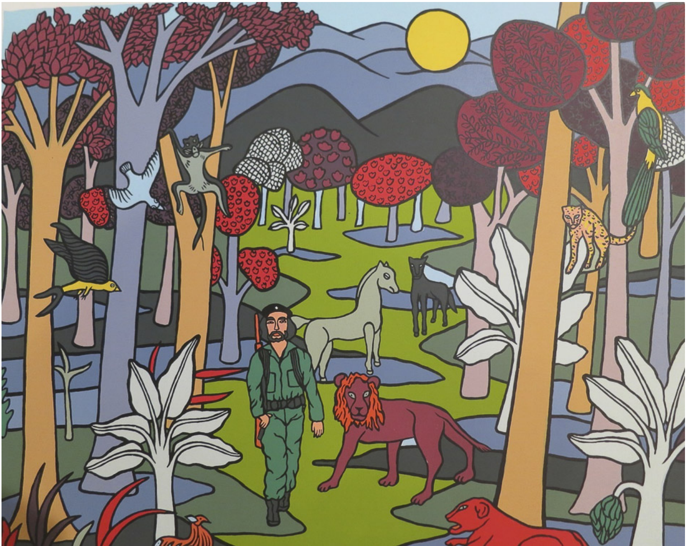
《一名美国士兵》艾丽西亚·莱尔（古巴）作于1997年

美国政府估计，这场历时20年的战争是美国在现代史上持续最久的战争（美国对越战争从1961年到1975年持续了14年）。但阿富汗的这场战争并不是美国政府发动的最长战争。美国有两场战争仍在继续：自1950年8月起对朝鲜的战争；自1959年9月起对古巴的战争。美国继续对朝鲜、古巴实施混合战争，这些冲突远未结束。 混合战争 无需调动全副武装，是通过控制信息和资金流，利用经济制裁，非法破坏等手段进行的战争。毫无疑问，美国对朝鲜、古巴的战争是历时最久、尚未终结的美国对外战争。