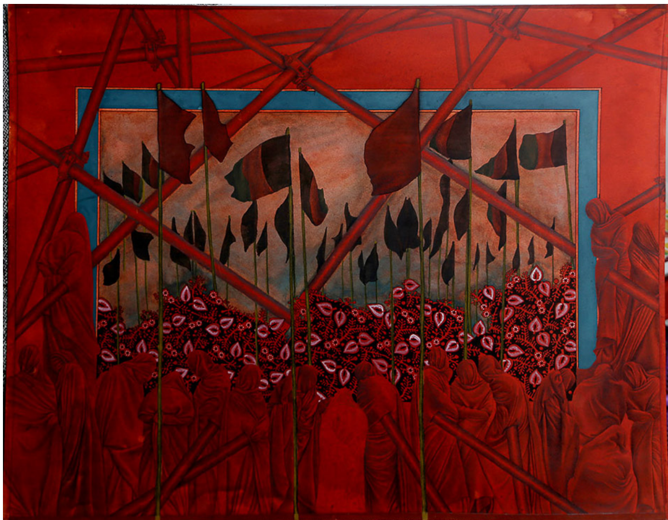
《红色重生》穆赫辛·塔莎·瓦希迪（阿富汗）作于2017年