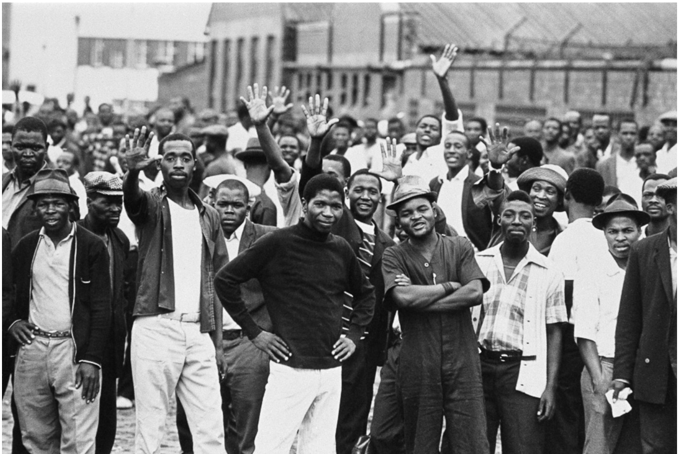
1973年2月，联合纺织厂一群纺织工人罢工，要求增加5兰特日薪

一旦上台，这些包裹在卡其制服和上好锦缎套装里的丑陋政权就推行紧缩政策，对一切工农运动祭出铁拳。但他们无法击垮人类的精神。在世界很多地方（如巴西、菲律宾、南非），是工会打响了反对暴政的第一枪。1975年，菲律宾拉通德纳酒厂工人发出怒吼“我们受够了！太过分了！我们要反抗！”由此演变为反抗马科斯独裁统治的街头抗议，最终导致了1986年的人民力量革命。在巴西，从1978年到1981年，产业工人在卢拉（如今的巴西总统）的领导下，在圣保罗大区的圣安德烈、圣贝尔纳多·杜坎普、南圣卡埃塔诺等工业城市开展行动，使全国陷入瘫痪。这些行动激励了巴西工农，振奋了他们反抗军政府的信心，结果导致其在1985年垮台。