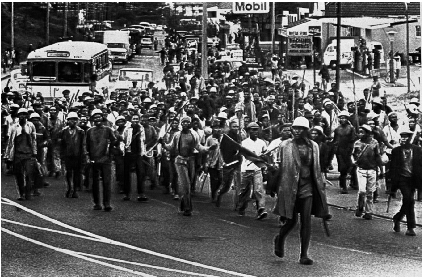
加冕砖瓦公司工人在德班北海岸路游行，一名挥舞红旗的工人领头

习惯性殖民思维让很多人误以为民主起源于欧洲，或是在古希腊（此地贡献了“democracy”一词，“demos”意为“人民”，“kratos”意为“统治”），或是通过英国1628年《权利请愿书》、法国1789年《人权和公民权宣言》等人权传统的兴起。然而这不过是欧洲殖民者的后见之明，它将古希腊挪为己用，避而不谈古希腊与北非、中东的紧密联系，利用实力使世界很多地方产生思想上的卑微感。欧洲殖民者如此这般地否定了民主变革史上的一些重要成就。我们至今仍推崇民主理论家书写的理想，却往往遗忘了那些为了建立基本尊严、反对卑劣等级制度的斗争。