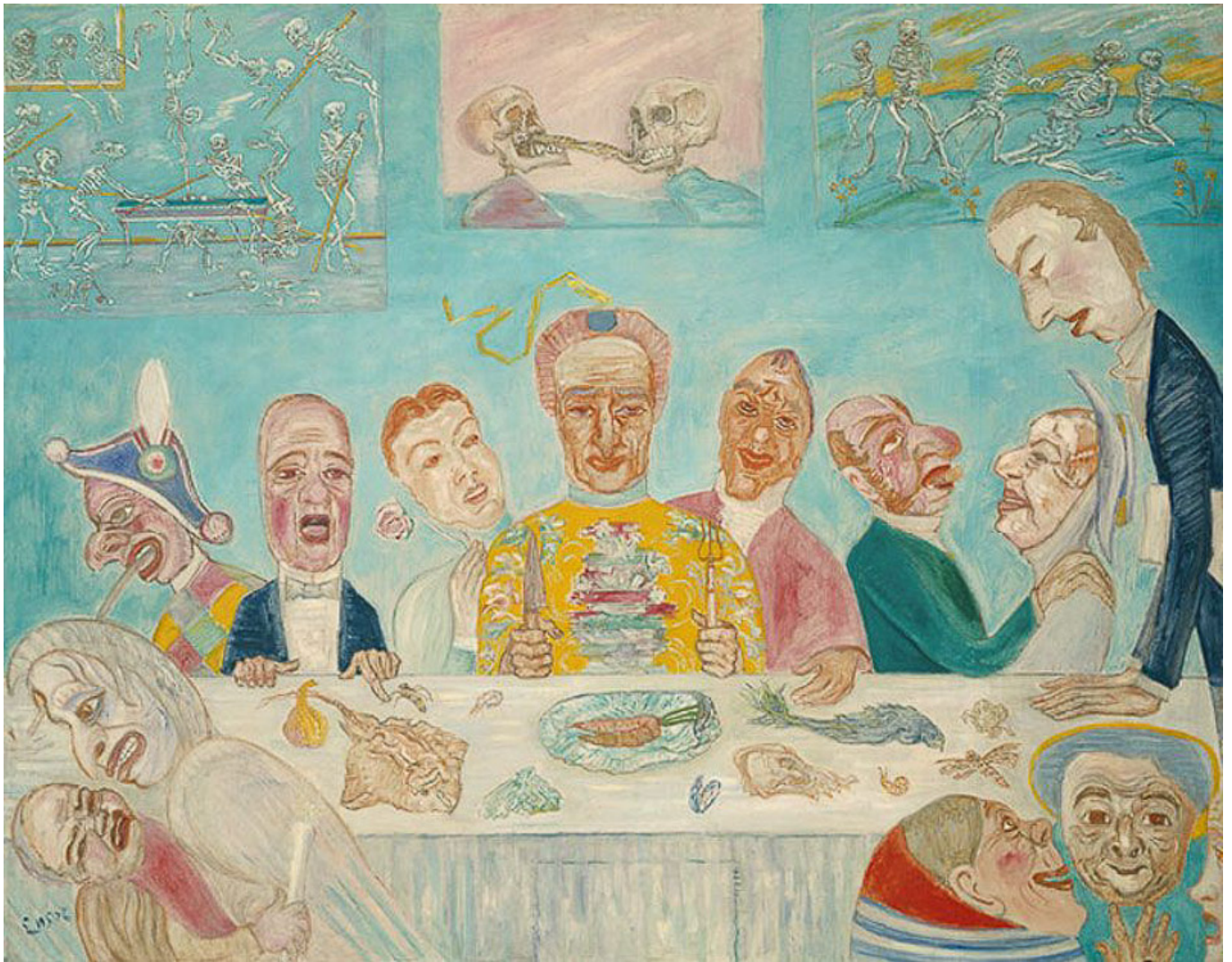
James Ensor, 《滑稽的就餐(饥饿者的宴会)》, 1917-18.

英国教士托马斯·马尔萨斯（Thomas Malthus）写道，亘古不变的是，食物生产将以算术的方式增长（1-2-3-4），然而人口却以几何的方式增长（1-2-4-8），因此人口对于食物的需求量很容易就超过人类生产食物的能力，他的观点是错误的。1789年，当马尔萨斯还在忙于他的专著时，世界人口为10亿左右。现在这个数字几近80亿，但是科学家们告诉我们的是：我们的粮食绰绰有余，可以喂饱每个人。然而，饥饿仍然存在。原因何在？