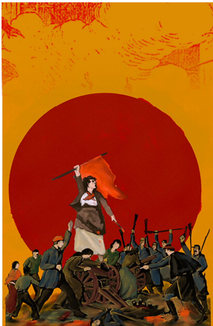
《巴黎公社150年》朱奈娜·穆罕默德（印度）作于2021年

巴黎公社失败的几周之后，卡尔·马克思就其经验教训为国际工人联合会（第一国际）总委员会撰写了一本名为《法兰西内战》的小册子，评价了这次起义的本质，即社会主义社会可能性的可贵示范，以及社会主义社会建立自身国家体系的重要意义。马克思充分理解历史的曲折性，认识到，尽管资产阶级夺回巴黎时进行了屠杀，但由1789年法国大革命开启的、1871年巴黎公社传承的历史潮流是不可阻挡的：旧时代遗留的旧等级制度和资本主义产生的新等级制度，对于民主精神而言是不可容忍的。