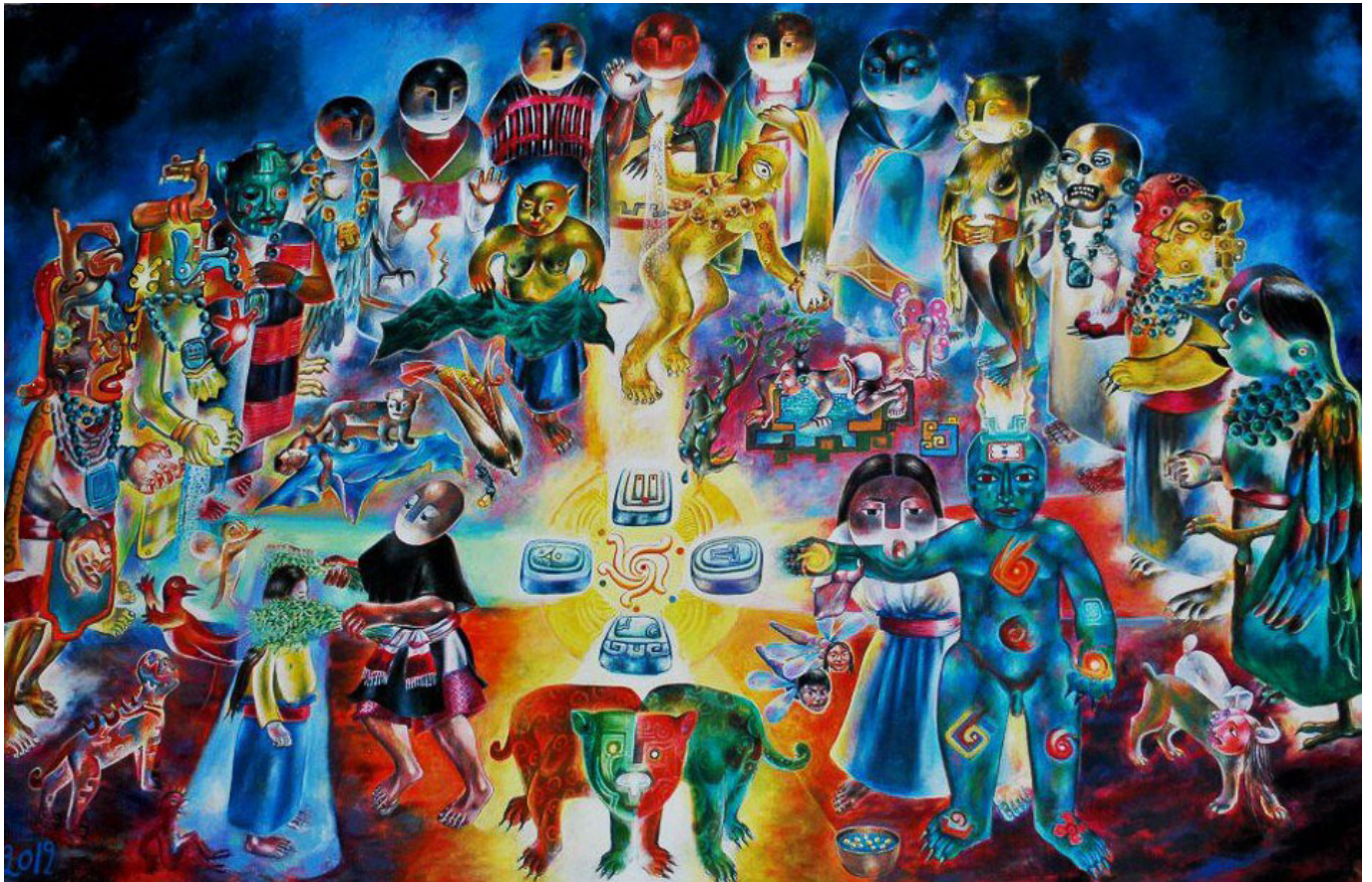
AntúnKojtomLam (墨西哥), Ch'ulel , 2013