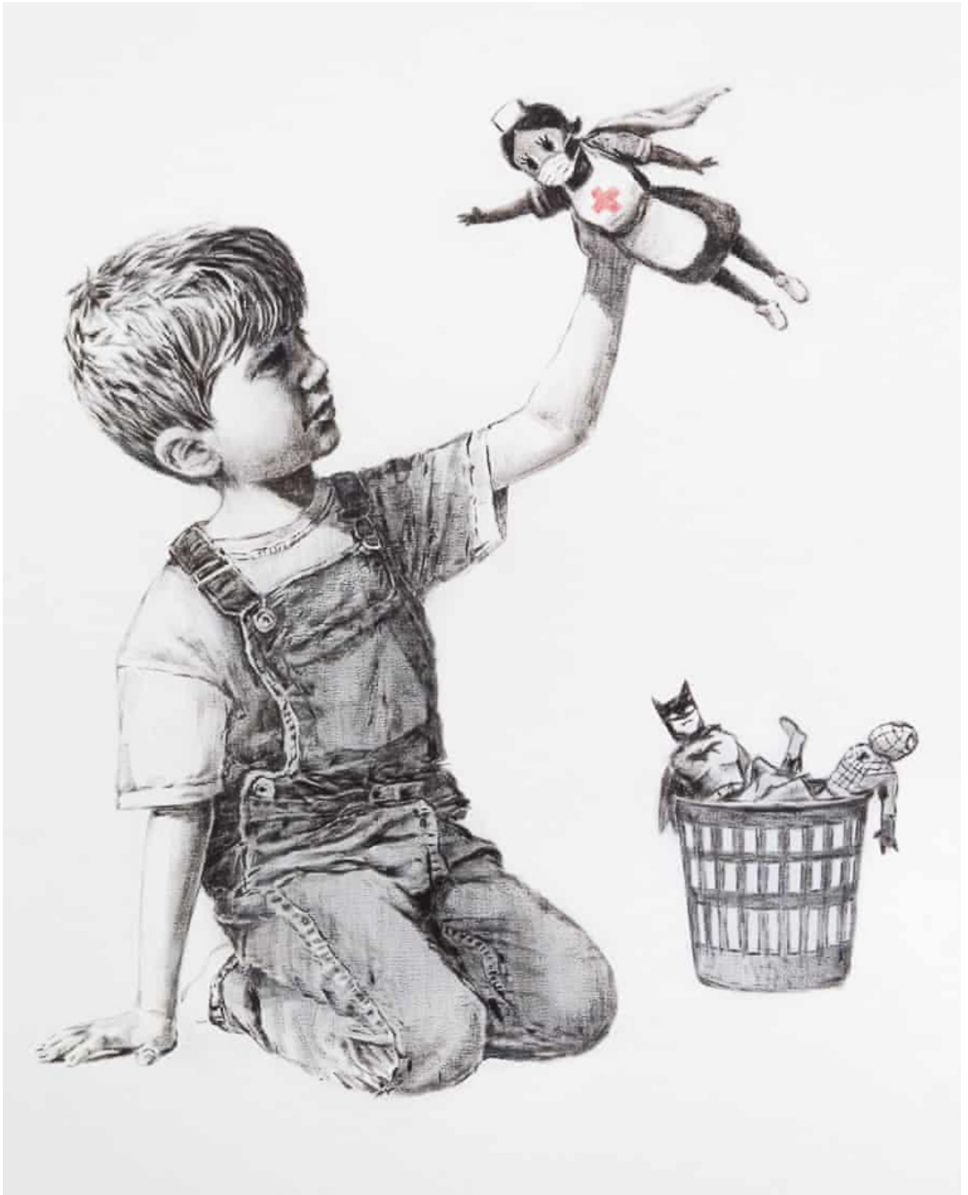
班克西（未知），《游戏改变者》，2020