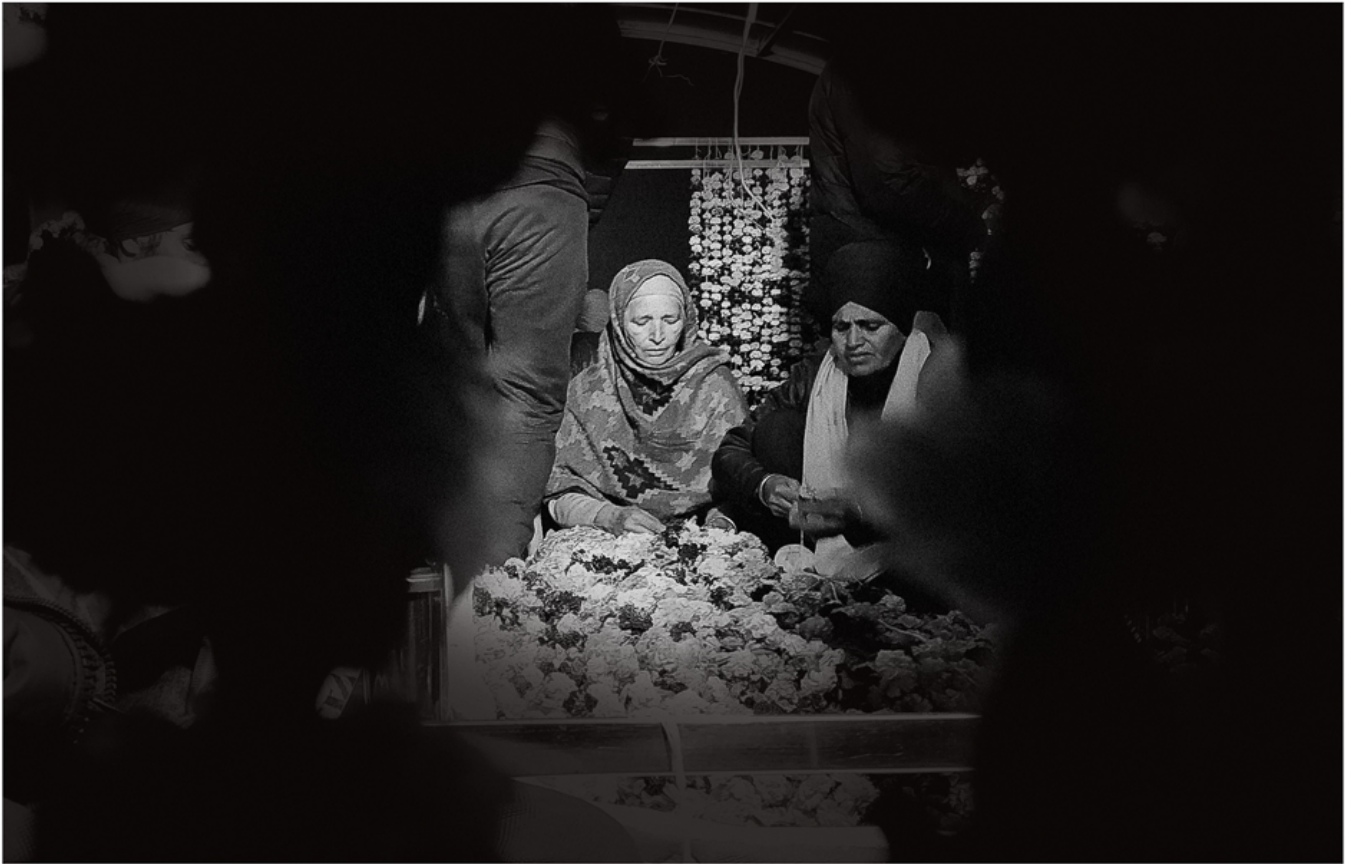
2020年12月31日，在德里和辛古的交界处，妇女们在装饰一种锡克教的结构。

莫迪不会轻易放弃对超大型企业集团的忠心，农民和农业工人也不会拿性命投降。这种对峙绝无轻松解决之道。大部分城市民众都同情这些为他们提供粮食的人。政府往往以执行封锁的借口为掩护尝试使用武力，但以失败告终。莫迪政府会冒险使用更强大的武力吗？如果使用了，公众能够容忍吗？这些问题不好回答。