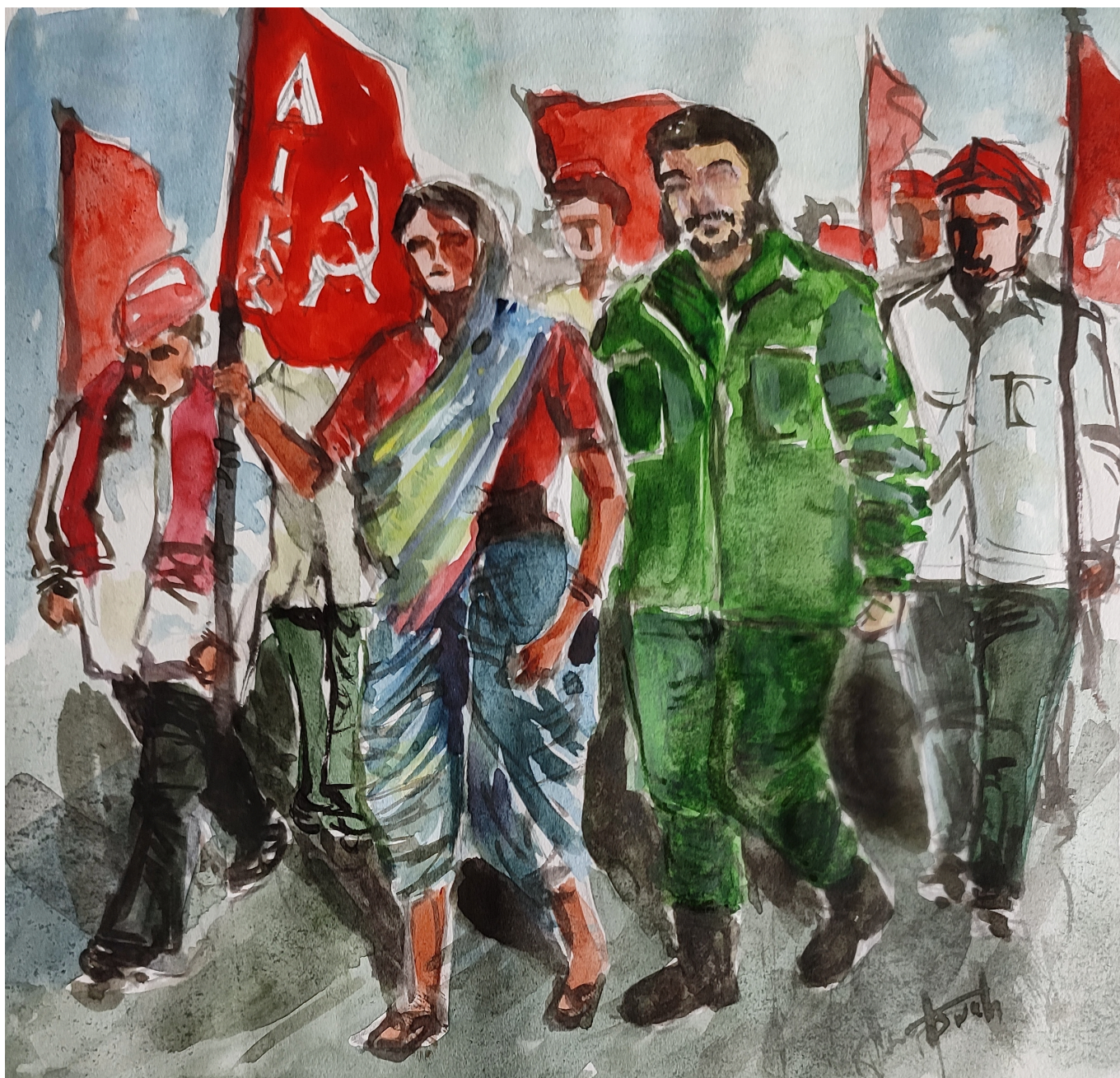
《与农民共同前行》阿斯瓦特（印度“青年社会主义艺术家”） 作于2021年。

本期新闻稿中的照片来自上述汇编文章，摄影师为三大洲社会研究所艺术部成员维卡斯·塔库尔。维卡斯在谈到这些照片时写道：“它们描绘了一群有名有姓、不懈奋斗、理想远大的人类、一种生活方式，描绘了一个阶级，描绘了一次具有历史意义的抗议。”