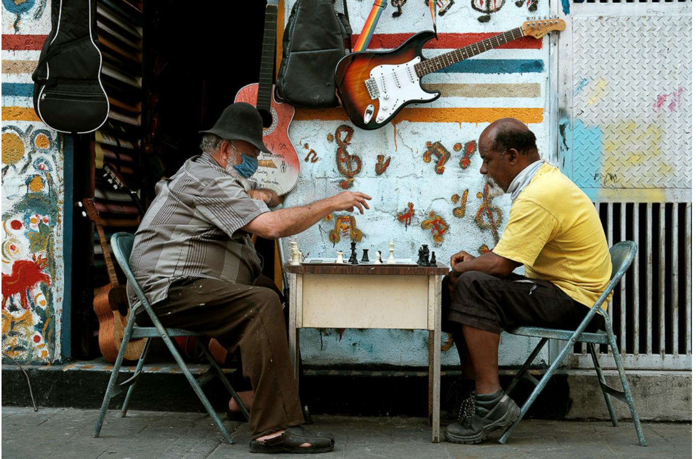
Dikó, Cacri Photos (委内瑞拉), 《新冠肺炎时期的国际象棋》, 加拉加斯, 2020

国际劳工组织(International Labour Organisation)的预测报告总不能也是在夸大其词吧。事实上,情况正如预期的一样糟,甚至是更糟。国际劳工组织在7月初召开的关于新冠肺炎与劳动世界的会议上的一份概念文件中说道,疫情已导致至少3.05亿人失去工作,大规模失业带来的影响正在以一种缓慢却切实的方式冲击着美洲大地。这个数字只是一个保守的估计,更激进的数据显示,多达半数的劳动人口没有获得足够的收入。国际劳工组织写道,在工作方面,病毒”以最严厉和最残酷的方式打击了最弱势和最脆弱的群体,暴露出了不平等带来的破坏性后果”。