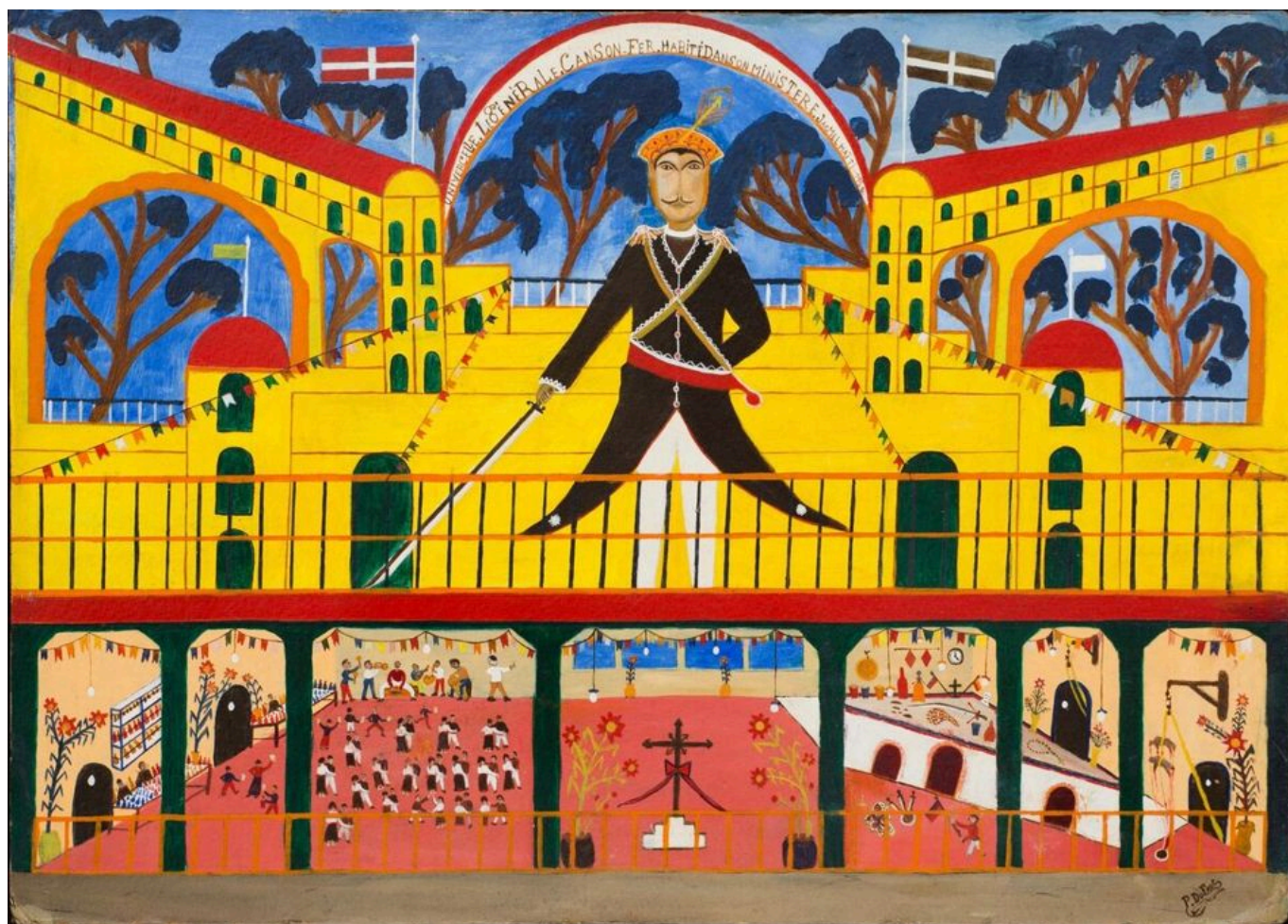
《康森将军》普雷费特·达福（海地）作于1950年