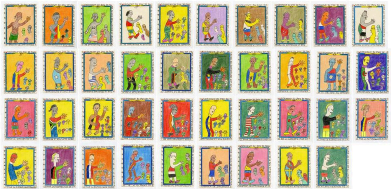
《网球场宣言》弗雷德里克·布鲁利·布瓦雷（科特迪瓦）作于2010年

政府间气候变化专门委员会第六次报告表明了一个重要事实：“全球变暖在很大程度上是由历史累积的二氧化碳排放造成的。”这意味着，在全球南方国家尚未实现电气化普及等基本需求之前，全球北方国家已将地球推向了毁灭的边缘。例如，非洲54国的总碳排放 仅占 全球的2-3%，非洲12亿人中还有一半人 用不上电 。然而极端气候 事件 却在非洲大陆频频发生，如非洲南部的旱灾和气旋灾害、非洲之角的洪灾、萨赫勒地带的荒漠化等。我们在6月5日世界环境日，与 国际反帝国主义斗争周 （International Week of Anti-Imperialist Struggle）联合编写并发布了 第11期红色警报 ，深入阐释了气候危机的科学、政治动因、“共同但有区别的责任”以及改变现状的措施。