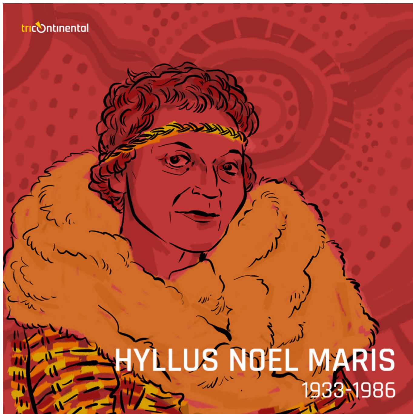
海卢斯·诺埃尔·马里斯

约塔约塔族诗人、教育家海卢斯·诺埃尔·马里斯（1933-1986）也必定会赞同，她1978年的诗作《土人颂歌》（Spiritual Song of the Aborigine）为踏上拯救地球征程的勇士唤起希望、奏响乐章：