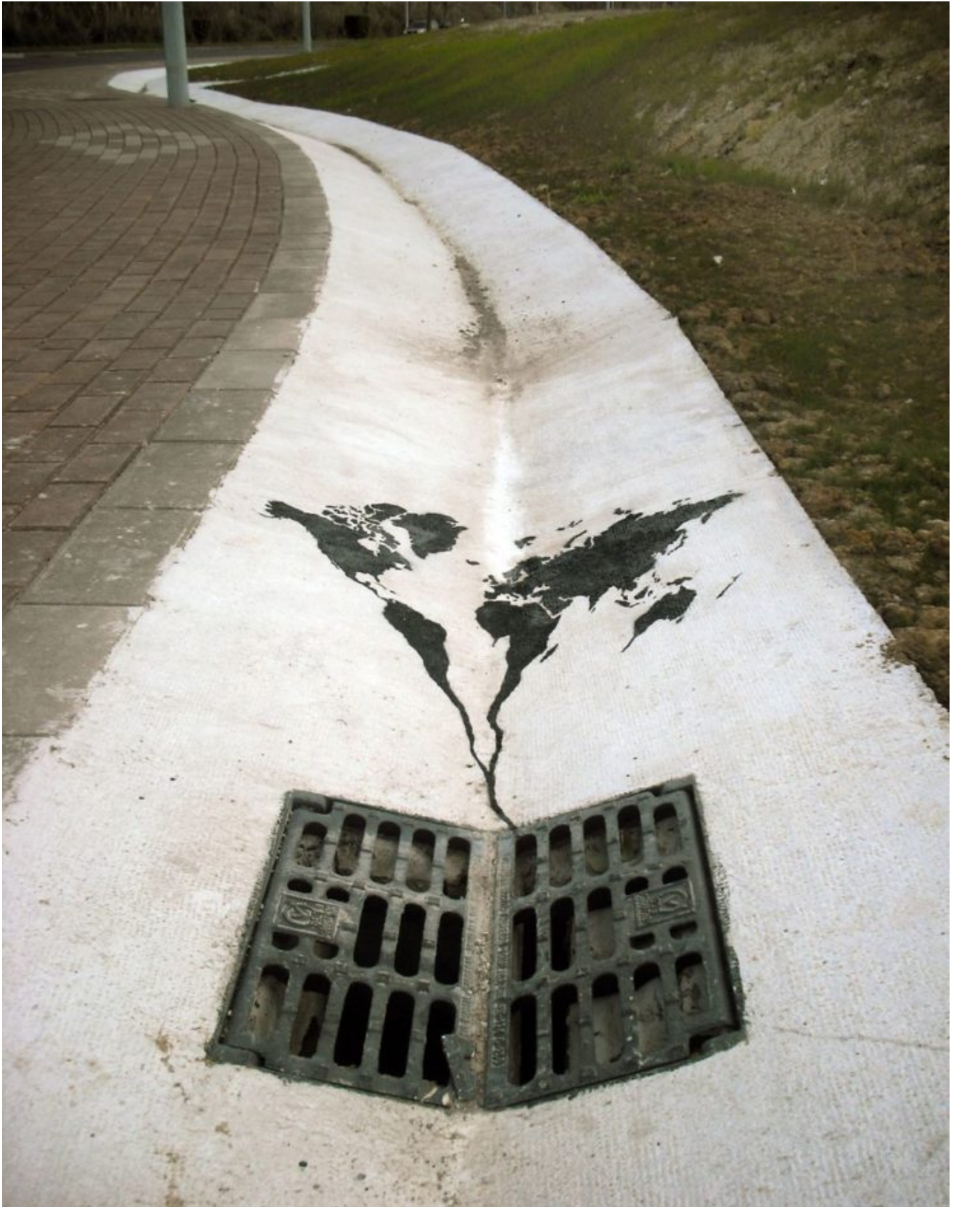
《污痕》佩贾克（西班牙）作于2011年