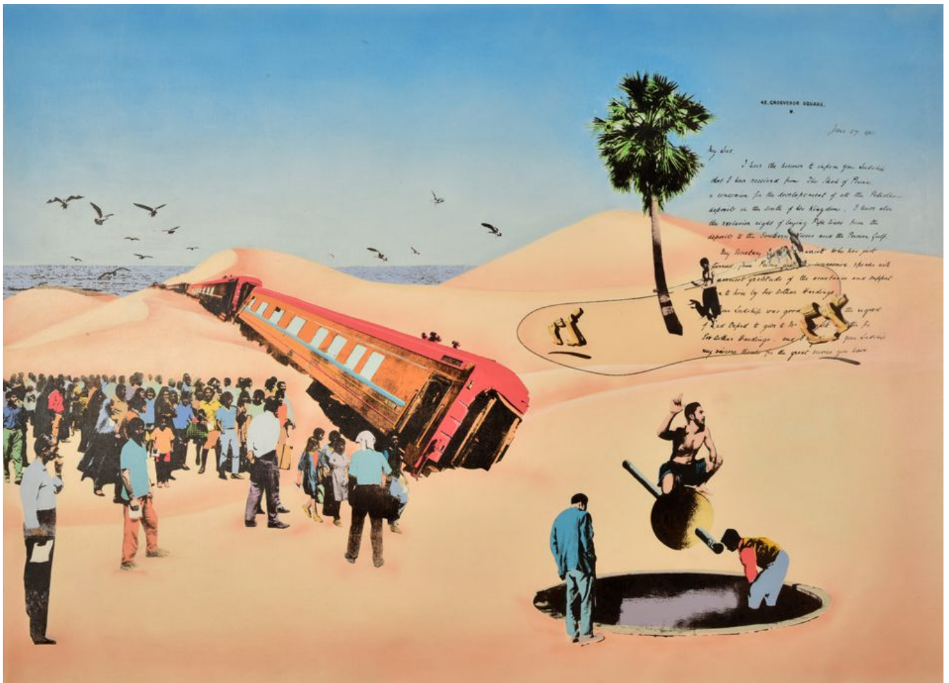
《漫游》阿明·罗桑（伊朗）作于2019年

生物多样性受损和气候变化之间的联系清晰可见：仅因开放湿地就给大气层平添了史无前例的碳排放量。深度减排和资源管理优化势在必行。