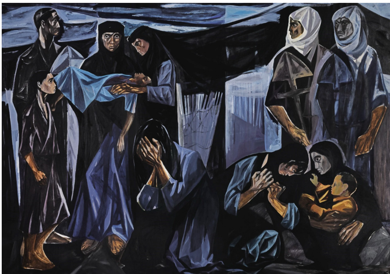
《孩童之死》马哈茂德·萨布里作于1963年