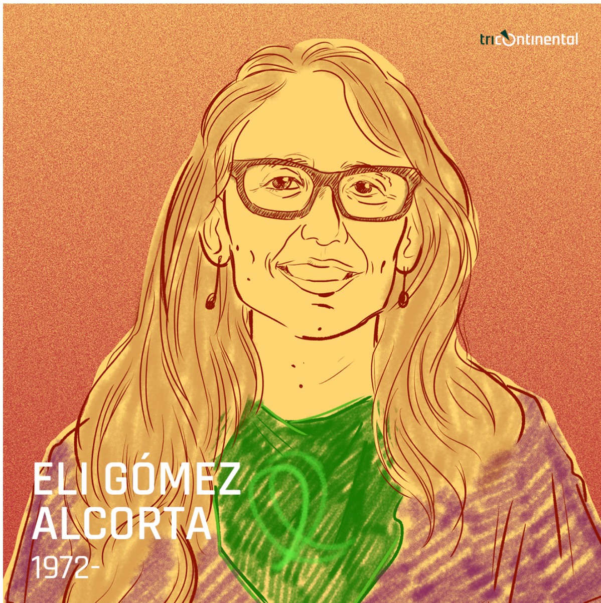
伊丽莎白·戈麦斯·阿尔科塔

本报告由阿根廷政府妇女、性别与多样性部部长伊丽莎白·戈麦斯·阿尔科塔作序。戈麦斯·阿尔科塔是一位律师，几十年来一直参与建设美好世界的斗争。她为这份报告所作的序言非常有力，充分体现了她的经验和阿根廷女权运动的经验。