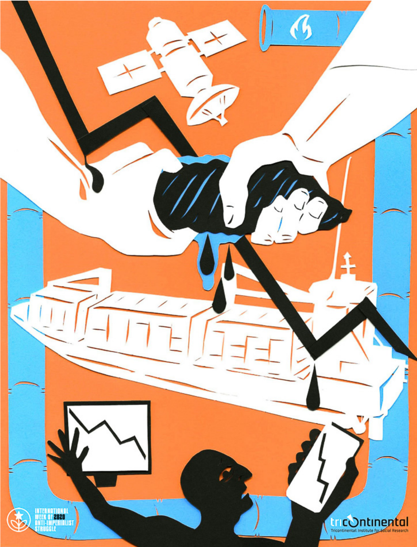
Madhuri Shukla (USA) 《折磨》 2020年