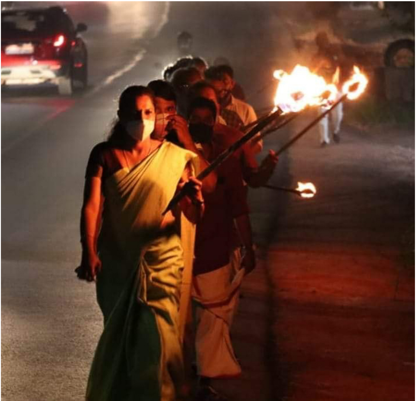
PP·迪威雅领导声援印度农民的抗议活动

喀拉拉邦的左翼力量参加这次选举有一系列重要优势。首先，通过一个 世纪 的斗争与治理，共产主义运动已经推进了改善人们生活条件的议程，其中包括改善卫生、教育、住房，同时培养了公众行动的传统。其次，正是左翼在25年前发起了人民规划 运动 ，这一进程激活了地方自治机构，使它们成为公众行动以及推进左翼计划的关键平台。再次，当前的左翼民主阵线政府在疫情前就有着危机管理的模范记录，比如2018年侵袭该邦的严重 洪灾 及 尼帕 病毒疫情。第四，左翼力量在该邦的群众组织关注人民的需求，经常致力于提供救助、反抗社会不公、争取扩大人民的权益。这一点在本次疫情期间尤为显著，学生组织、青年组织、妇女组织、工人组织、农民组织为群众提供食物和药品，搭建公用洗漱设施，协助当地政府检测、追踪以及实施隔离。正是这样的群众工作化解了来自企业型媒体的恶意。