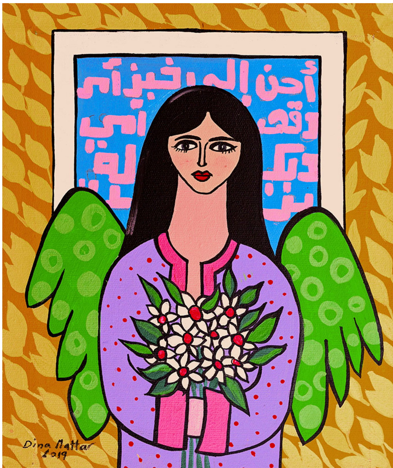
《无题1》迪娜·马塔尔（巴勒斯坦）作于2019年