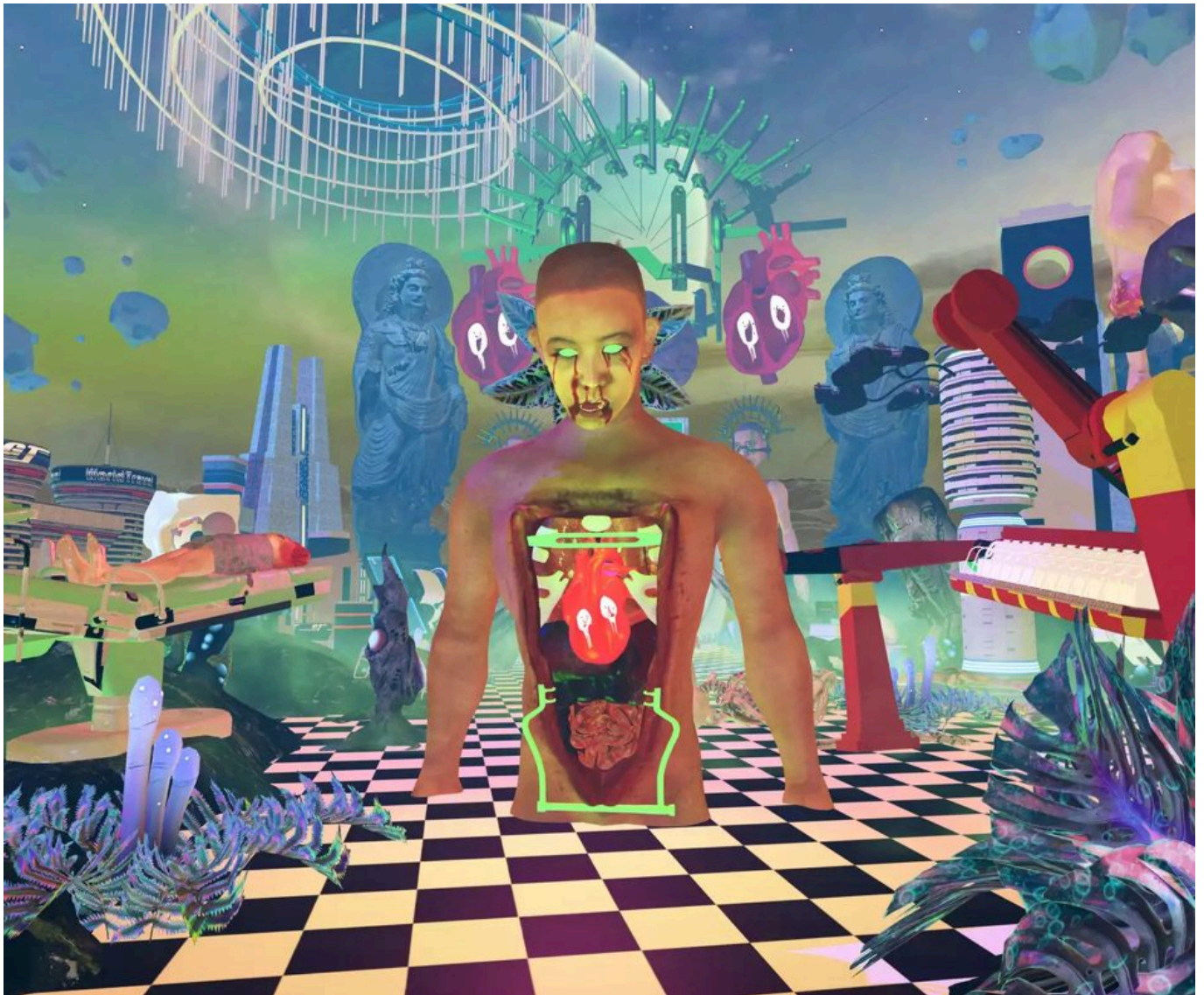
《妄想世界——中阴（之一）》陆扬（中国）作于2021