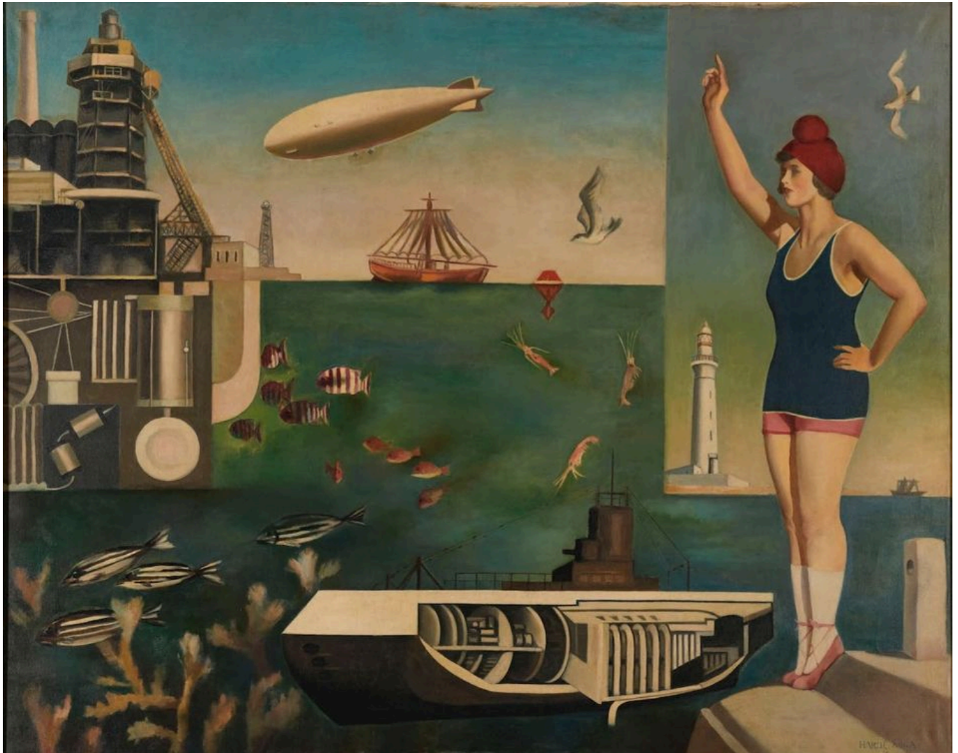
《海》古贺春江（日本）作于1929年