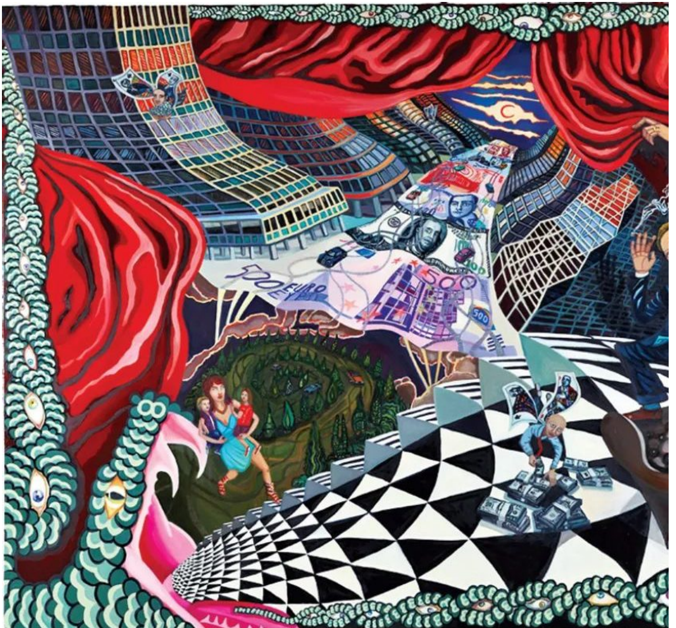
《资本》叶利夫·乌拉斯（土耳其）作于2009年

这一极其危险的升级证实了大多数美国俄罗斯和东欧问题专家的正确性，他们长期以来一直警告北约不要扩张到东欧。1997年，美国冷战政策的主设计师乔治·凯南说，这一战略是“整个后冷战时代美国政策最致命的错误”。乌克兰战争和进一步升级的危险充分证明了他警告的严重性。