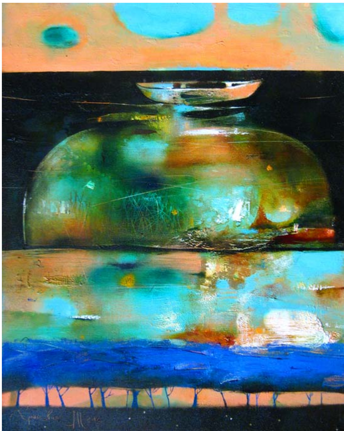
《愿望之河》塔提亚娜·格里涅维奇（白俄罗斯）作于2012年