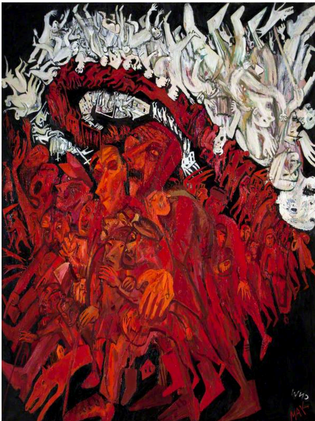
《历史的两种版本》 马克西姆·康托尔（俄罗斯）作于1993年

第14期简报明确评估了当前乌克兰国内和周边地区局势升级所带来的危险。正如我和摩洛哥工人民主之路党（Workers' Democratic Way）的阿卜杜拉·哈里夫在2020年发布的《布菲查反备战宣言》