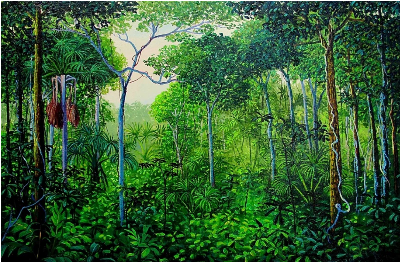
《绿色丛林》米格尔·潘哈（巴西）作于2017年

全球雨林遭受劫掠的规模和速度令人触目惊心。2021年，全球雨林覆盖面积 损失 了1110万公顷，略等于古巴面积。用时下世界杯的足球行话说，全世界每分钟损失的雨林相当于十个足球场。博索纳罗执政下的巴西去年经历了最严重破坏，损失了150万公顷雨林。往日植被浓密、动物繁多的雨林现已一去不返。卢拉在COP27上说：“我们将对非法森林砍伐进行严厉打击。”