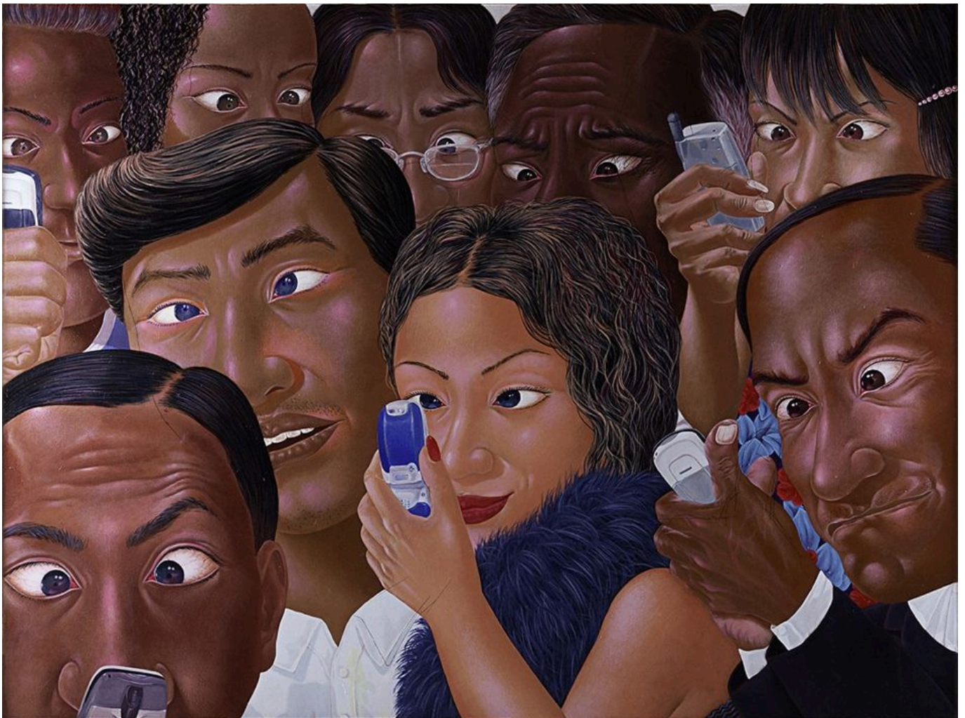
《斗鸡眼》 尼奥曼·马斯里亚迪（印尼）作于2005年

巴西、民主刚果、印尼的做法是在缓解、适应、投资的框架内酝酿的，而不是通过COP的空泛讨论。印尼环境与森林管理部副部长纳尼·亨德里亚蒂解释说，印尼将通过“蓝碳”计划（blue carbon）推广红树林生态游，制止旅游业对红树林的破坏，努力遏制国内长期泛滥的森林砍伐现象（比如，1980到2005年间，印尼广阔的红树林系统足足毁坏了40%）。例如，印尼采取新措施推广红树林间的螃蟹养殖，以阻止红树林破坏。本着这种精神，在COP27之后召开的二十国集团巴厘岛峰会期间，印尼总统佐科·维多多邀请各国领导人在努拉莱伊森林公园种下红树林种子。