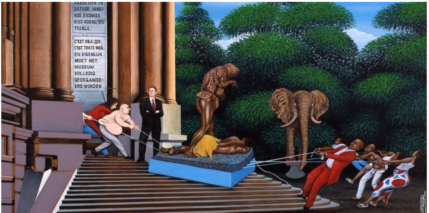
《重组》切里·桑巴（民主刚果）作于2002年