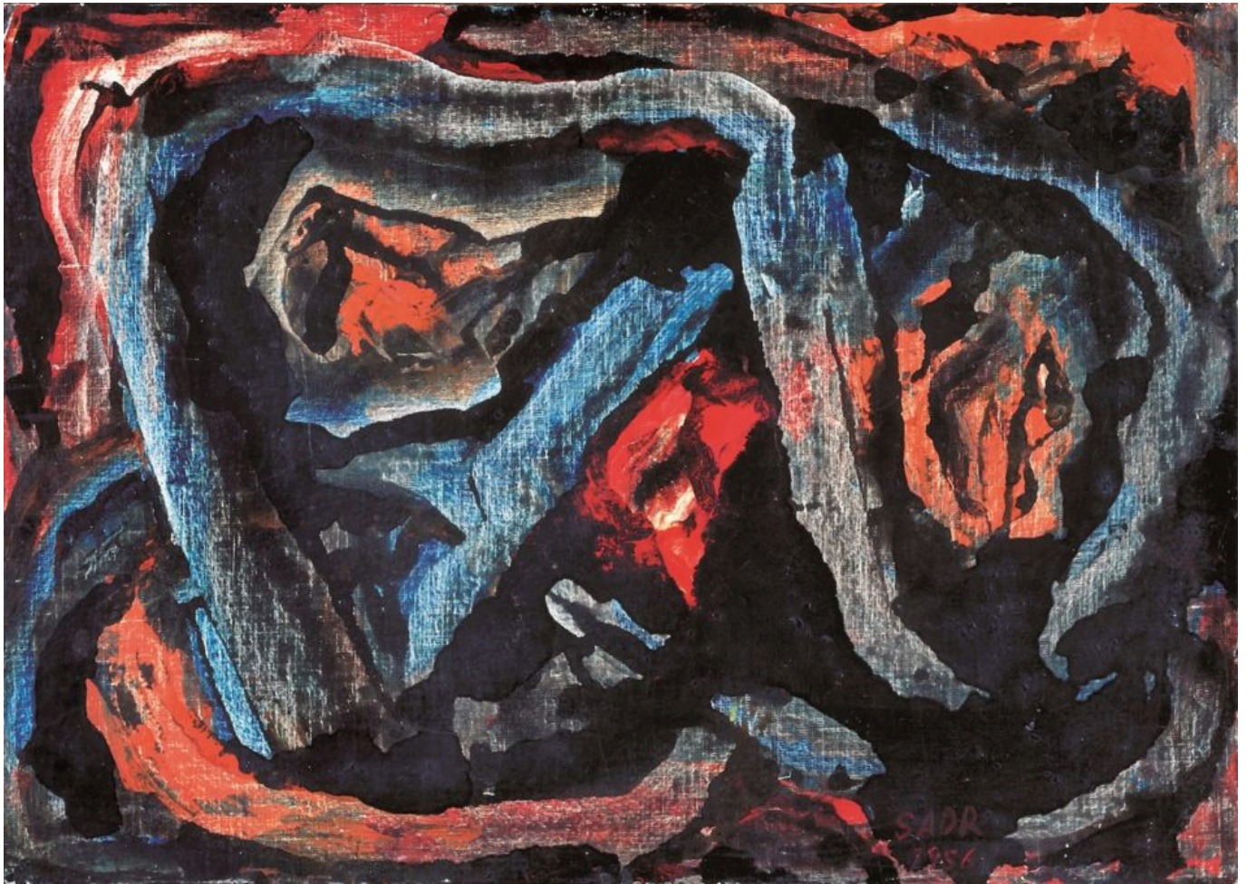
《无题》贝贾特·萨德尔（伊朗）作于1956年

多重危机的一个方面是性别不平等和暴力侵害妇女问题日益加深。联合国妇女署最新发布的 报告 《可持续发展目标进展：2023年性别问题概况》列出了一些令人极为担忧的数字。从目前的趋势来看，该报告预计，到2030年，全球将有3.424亿妇女和女童（估计占全球女性人口的8%）生活在极端贫困之中，近四分之一的妇女和女童将面临中度或重度的粮食不安全状况。报告估计，按照目前的速度，将有1.1亿女童和年轻女性失学。令人震惊的是，尽管多年来人们一直在为同工同酬而奋斗（这一点在苏联1920年6月颁布的工资率法令中得到确立）但男女薪酬差距仍然“居高不下”。 报告指出 ，“在全球范围内，男性每挣1美元的劳动收入，女性只挣51美分。在适龄劳动人口中，女性劳动参与率仅为61.4%，而男性则达90%。”联合国妇女署2023年报告重点关注65岁及以上的妇女。报告显示，在提交数据的116个国家中，有28个国家的老年妇女只有不到一半人有养老金，让人大失所望。而且所有的趋势线都在走低。