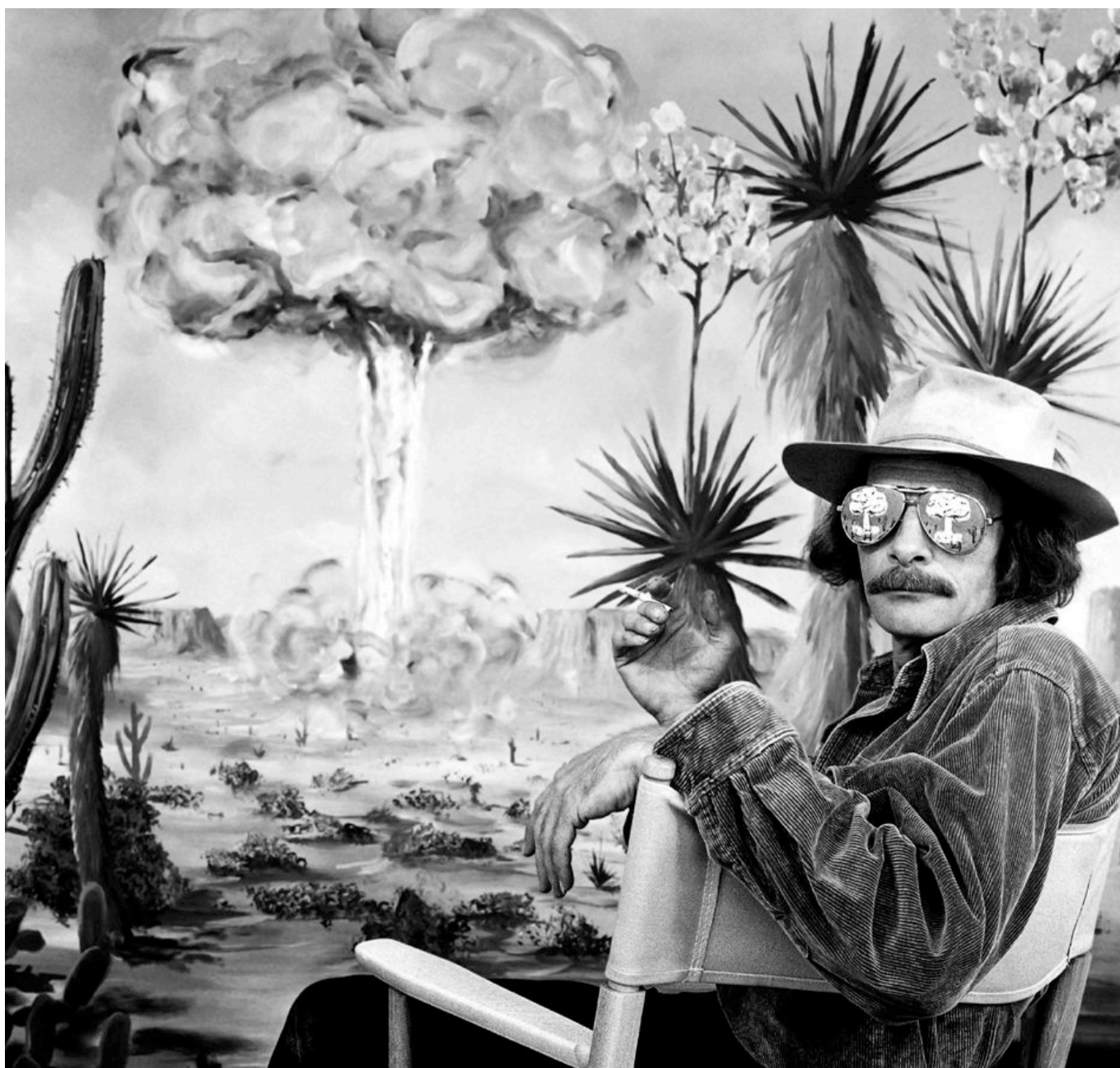
《托尼在亚卡台地》艾略特·麦克道尔（美国）作于1982年

全球现有1.27万件核武器，超过90% 属于 美俄两国，其余归另外七国所有。美、俄、英、法所持有的约2000枚核弹头处于高度戒备状态，可随时待命发射。美国在本国甚至欧洲等世界各地都部署了核武器；约100枚B61核弹 部署 在比利时、德国、意大利、荷兰、土耳其等北约成员国。2018至2019年间，美国单方面 退出 1987年与俄方达成的军控协议《中程核力量条约》（《中导条约》），俄方也随即退出。条约废止后，两国均可部署射程高达5500公里的地射导弹，将严重削弱欧洲及周边地区的安全架构。无疑，俄方认为美方退出《中导条约》意在将核导弹部署至俄边境，缩短打击俄方城市所需的时间。此外，美国正在 研制 价值1000亿美元的新一代导弹系统“陆基战略威慑”（GBSD），射程可达近1万公里。这种导弹可搭载核武器，能在几分钟内打击到地球任何地方。