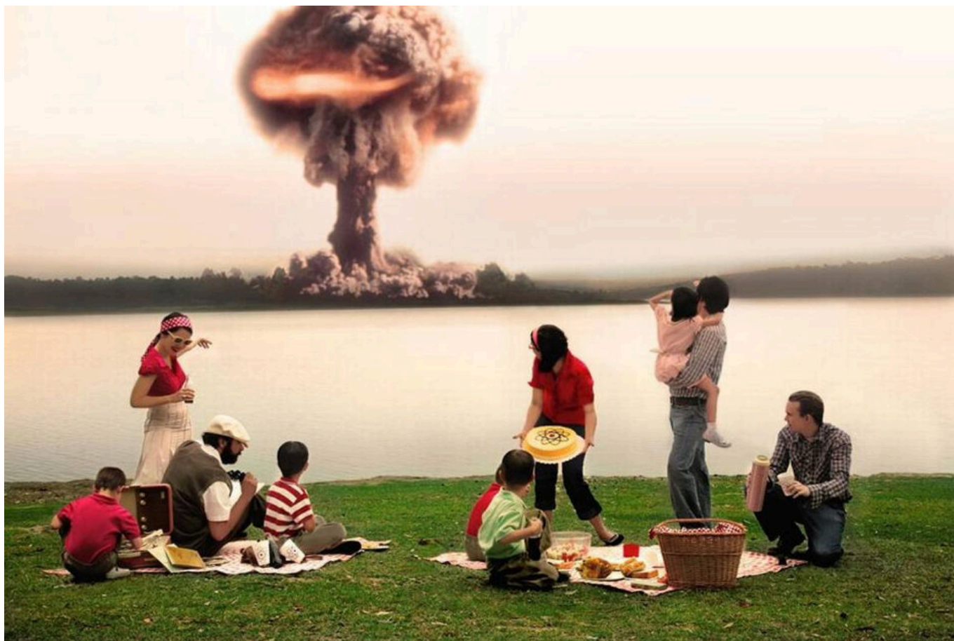
《核爆野餐》丹妮拉·埃德伯格（墨西哥）作于2007年