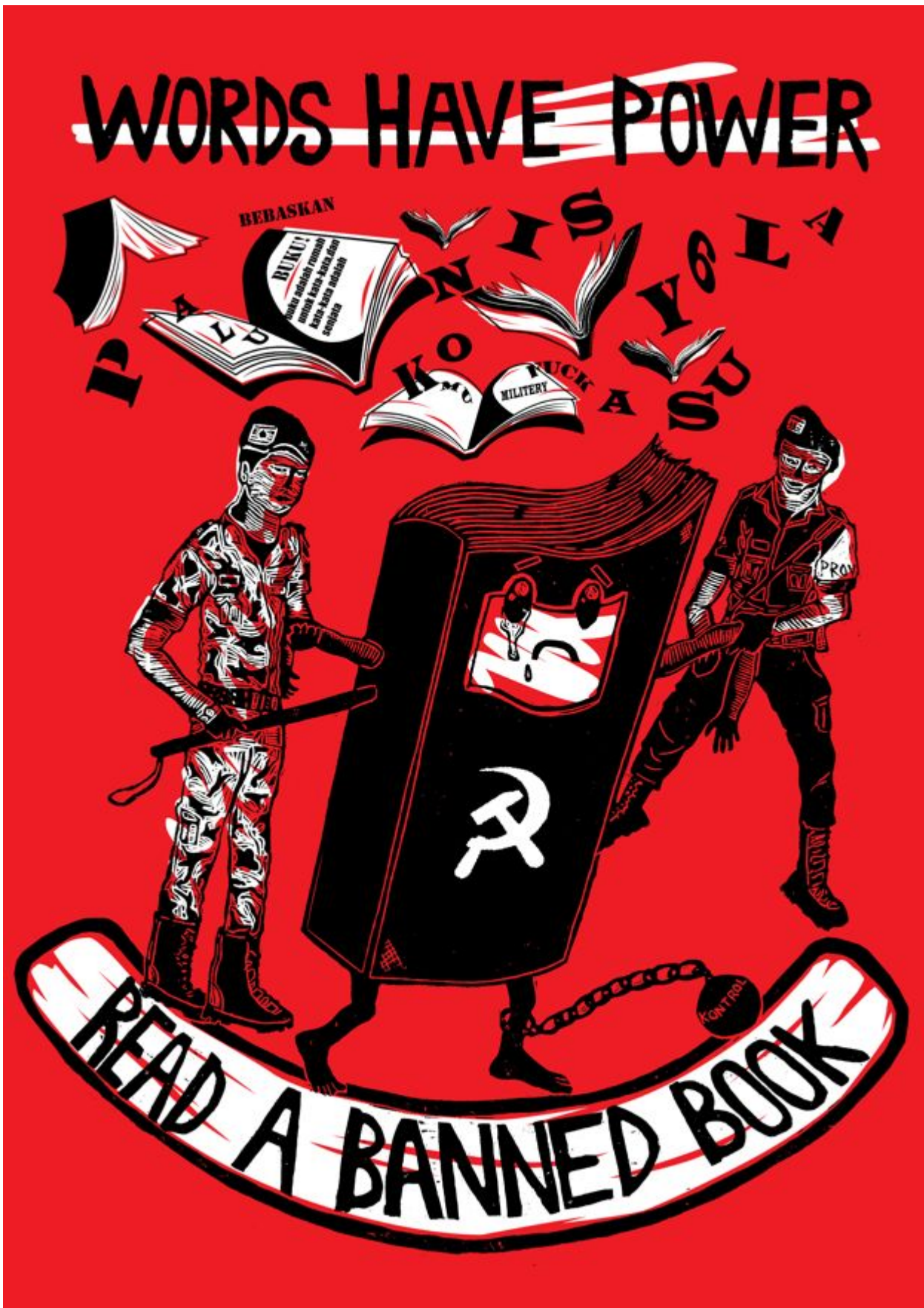
《阅读禁书》尤尼·林加（印尼）作于2023日