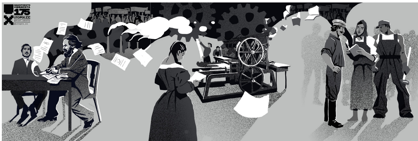
《1848》卡伊尔·阿贝罗（委内瑞拉）作于2023年