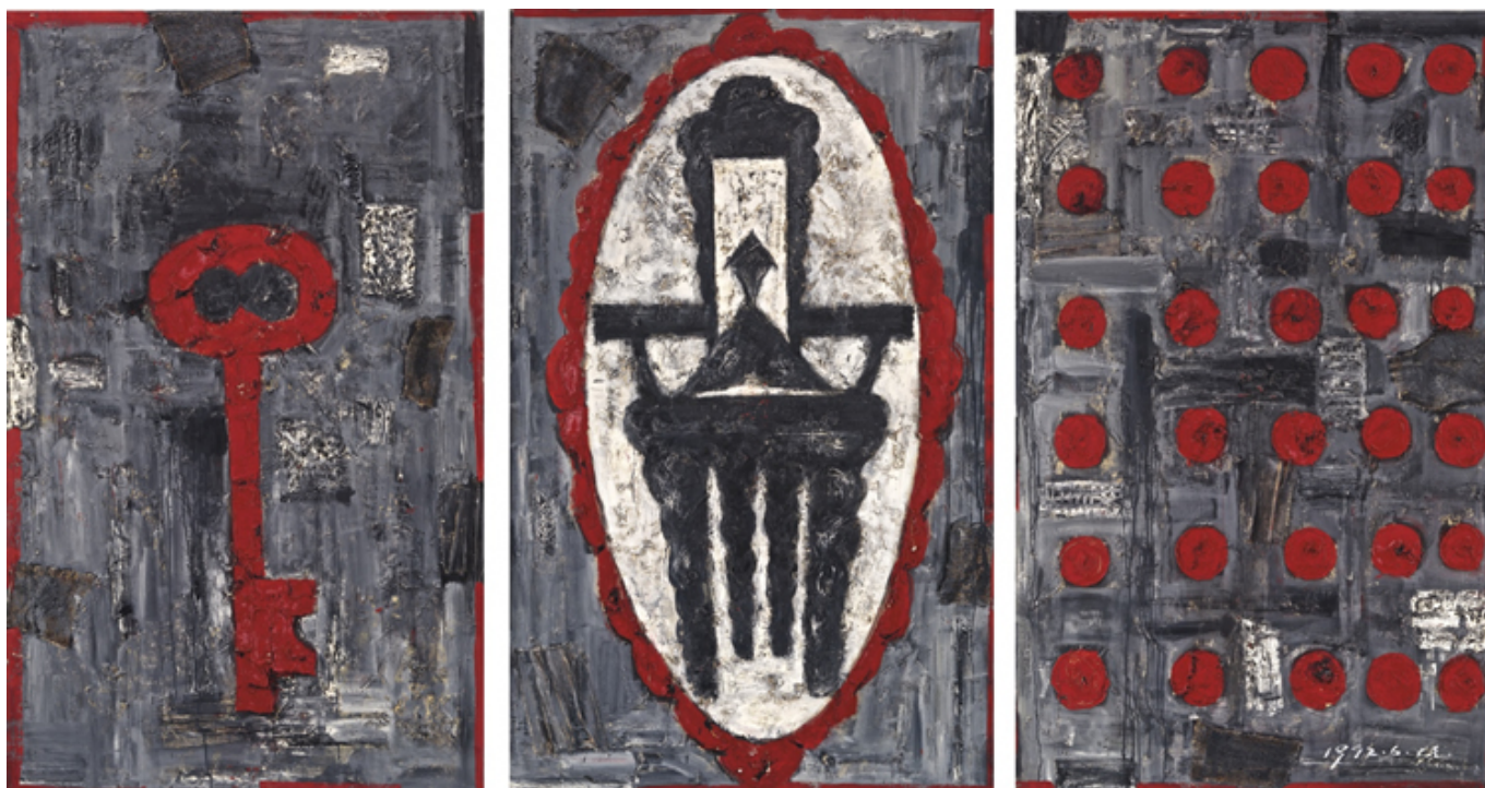
《92家长》毛旭辉（中国）作于1992年