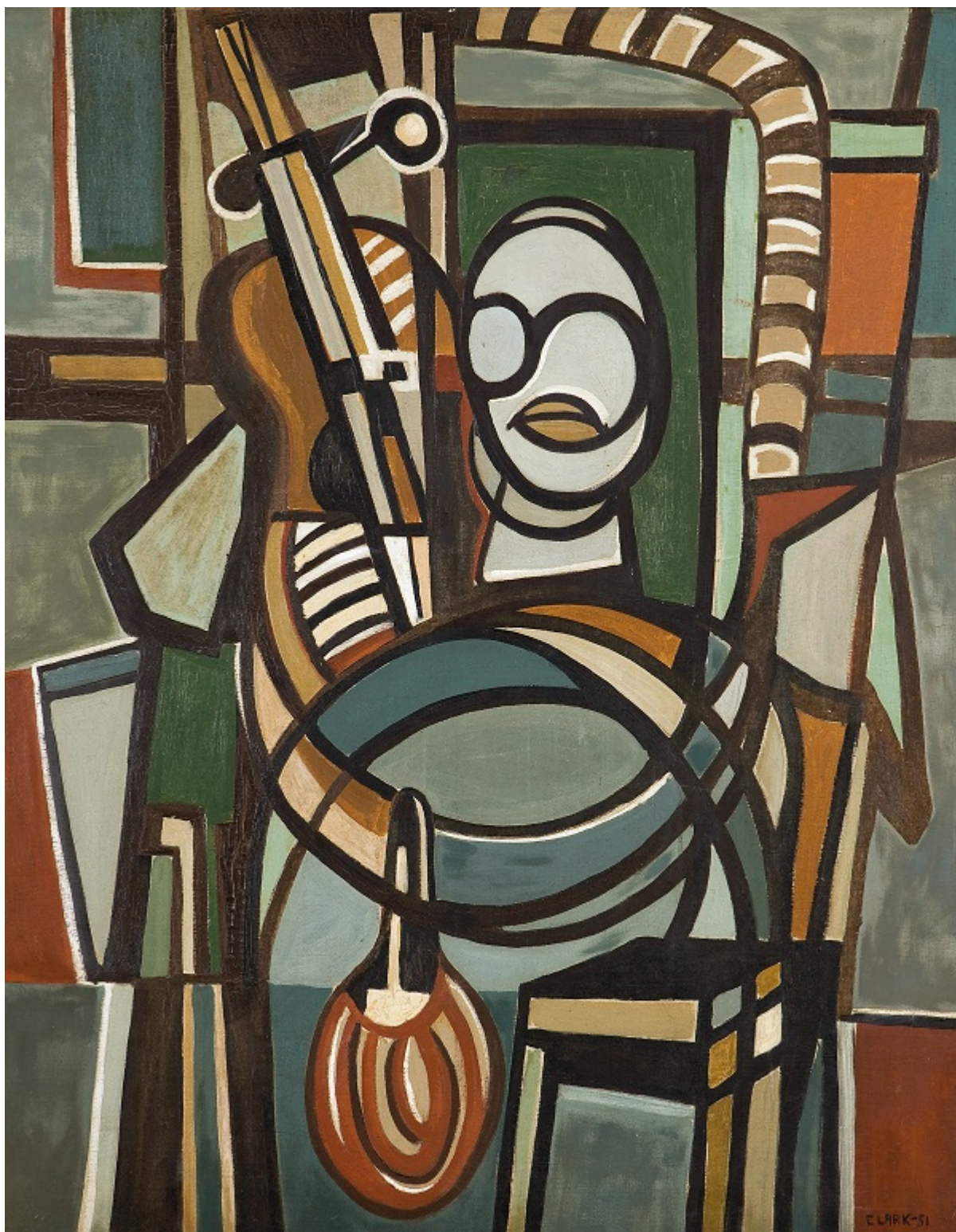
《大提琴手》利吉亚·克拉克（巴西）作于1951 年