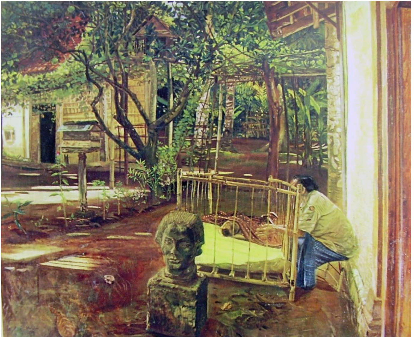
《村里》苏佐佐诺（印尼）作于1950年

那么，联合国所指全球巨变的具体原因是什么？首先，美国及其最亲密盟友的相对实力严重下降。西方资本家长期以来一直 抵制缴税 ，不愿支付个税或公司税（2019年，近40%的跨国公司利润被 转移 到避税天堂）。他们追求快速获利和逃避税务机构，导致西方国家内的投资长期 下降 ，基础设施和生产基础被掏空。西方社会民主党人从捍卫社会福利转而支持新自由主义紧缩政策， 任由 绝望和破坏生长，成为滋生极右翼情绪的温床。三角同盟无法从容治理全球新殖民体系，导致全球南方对美国及其盟友的“信任丧失”。