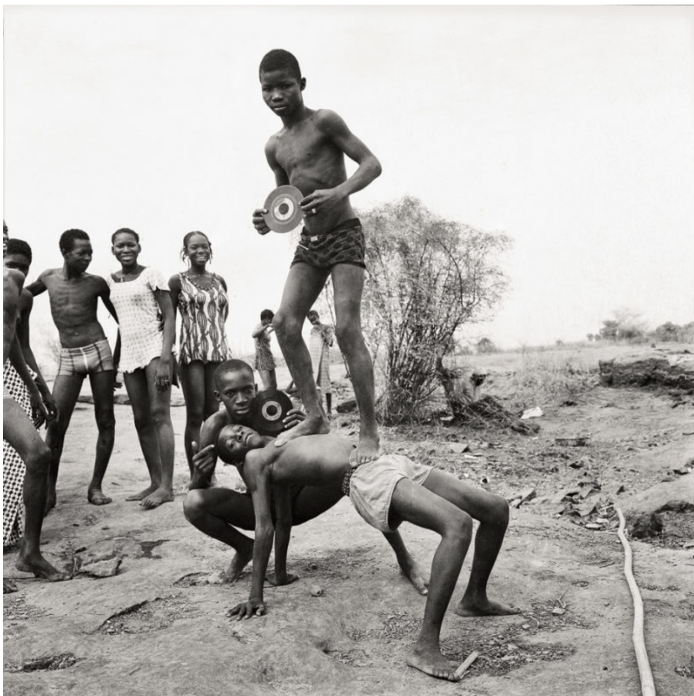
《公路野餐》马利克·西迪贝（马里）作于1972年

这不是马里第一次抛开法国，自主推动国家议程了。1960年，马里获得独立，莫迪博·凯塔总统领导国家，致力于稳固主权，推进泛非主义政治建设。1968年，穆萨·特拉奥雷将军离开军营，推翻了凯塔领导的社会主义政府。马里推翻凯塔的政变并非孤立事件，而是属于非洲一系列军事政变，其中包括：1961年布隆迪推翻路易斯·鲁瓦加索尔、1961年民主刚果推翻帕特里斯·卢蒙巴、1963年多哥推翻西尔瓦努斯·奥林匹亚以及1966年加纳推翻克瓦米·恩克鲁玛。