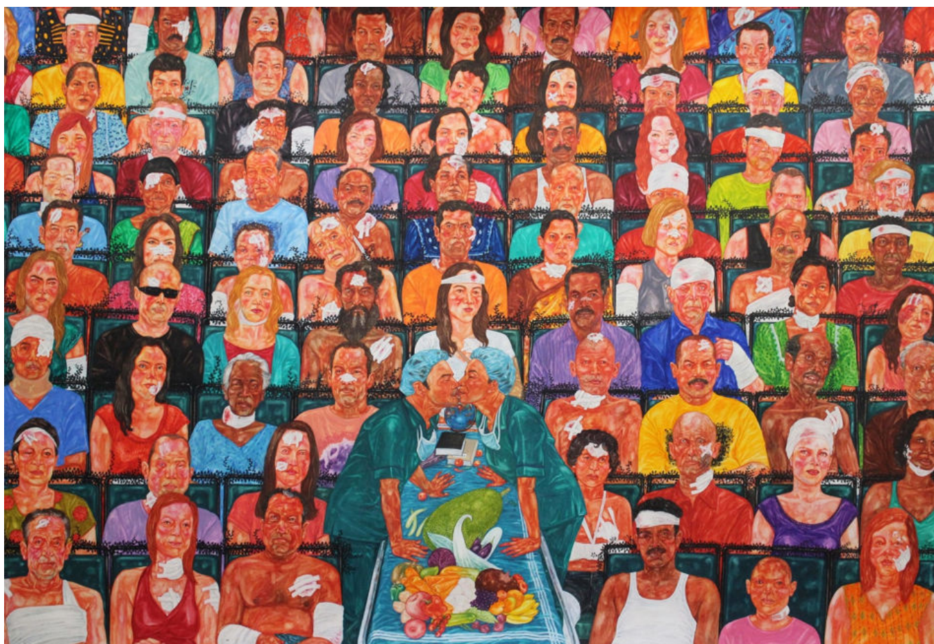
《我们定能改变世界》P.S · 贾拉贾（印度）作于2021年