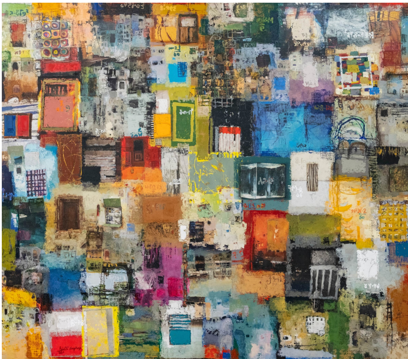
《漂浮城市之18》阿迪斯·盖泽哈恩（埃塞俄比亚）作于2020年

疫苗不公属于广义的医疗不公，与粮食不公、财富不公、教育不公一起构成当今时代的四大社会不公。联合国粮农组织的一份新报告显示，自2014年以来，非洲营养不良人口增加了8910万，2020年达到2.816亿。我们应该深思阿拉基亚对人性的发问、对区别对待不同人群的发问：能否对哈拉雷人和华盛顿人的生命一视同仁？我们能否战胜这些社会不公，解决全人类的基本问题，并结束当前经济政治体系对人类和自然的粗暴践踏？