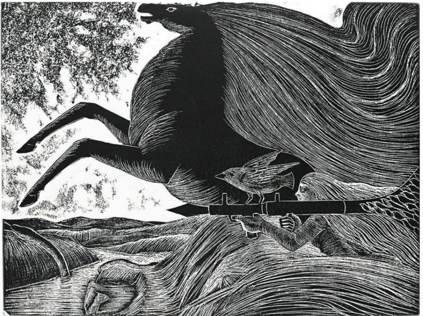
《卡拉梅战役》穆斯塔法·哈拉吉（巴勒斯坦）作于1969年

内塔尼亚胡的极限标准（即犹太人、不单是犹太复国主义国家对约旦河和地中海之间的土地拥有权利）并非突然出现在其政府声明之中。其根源在于以色列2018年的基本法（ Basic Law ），其中写道：“以色列国土是犹太人的历史家园，以色列国家在此建立。”这一法律手段将以色列确定为犹太人的国土，而不是一个多民族的领土。此外，“以色列国家”的各种行政定义都坚称对整个领土具有控制权。比如，以色列中央统计局（ Central Bureau of Statistics ）至少自1967年开始就错误地将居住在约旦河以西甚至西岸的以色列人列为以色列居民，以色列官方地图都没有体现1993年奥斯陆协议（ Oslo Accords ）所产生的内部划分。