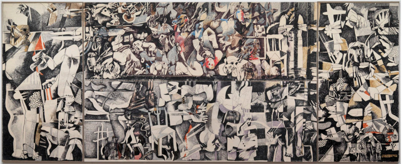
《贝鲁特难民营大屠杀》迪亚·阿扎维（伊拉克）作于1982至1983年间