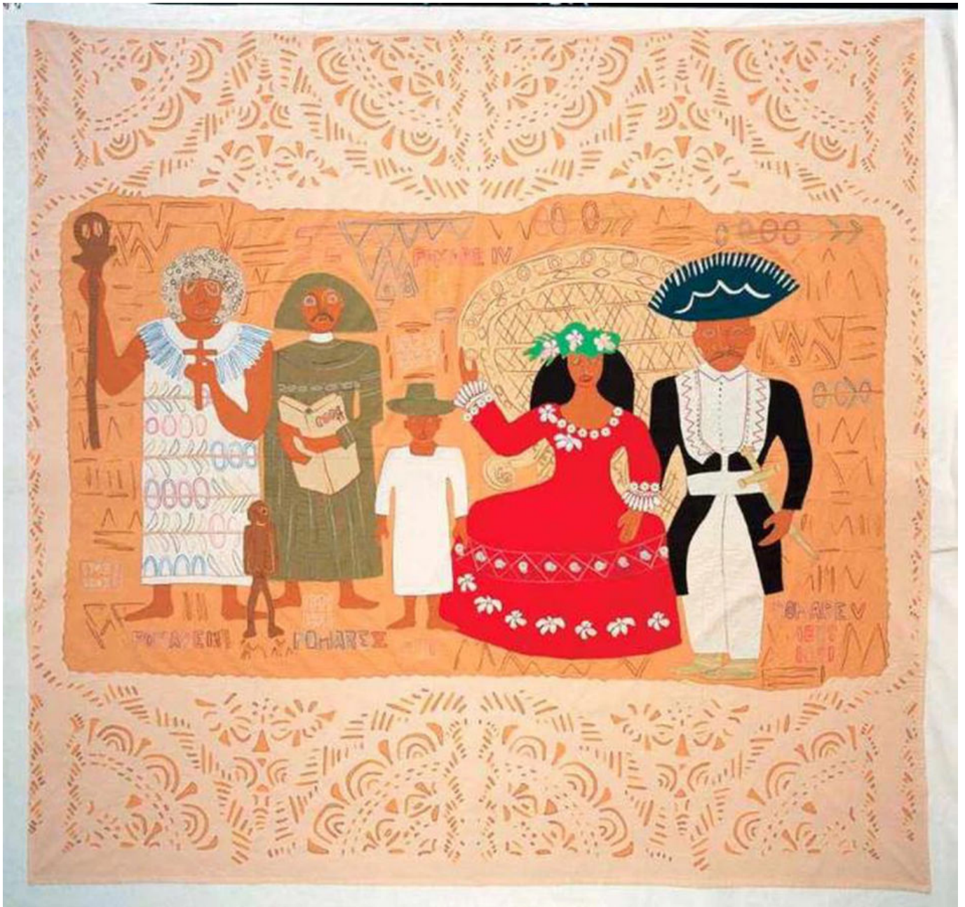
《波马雷家族》艾琳·阿玛鲁（塔希提）作于1991年

2021年全球战争开支超过2万亿美元，而据乐观估计，在清洁能源和能源效率上的投入仅有7500亿美元。2021年能源基建上的总投入为1.9万亿美元，但大部分投入流向了石油、天然气、煤炭等化石燃料。就这样，化石燃料投入持续进行，武器投入有增无减，而新型清洁能源的转型投入仍然不足。