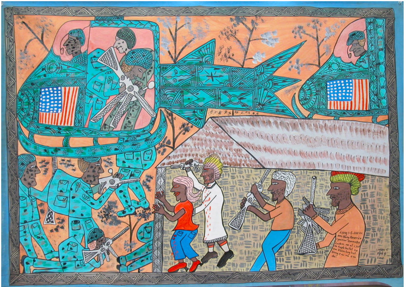
《美军发现躲在某处房中的拉登并将其杀死》西蒙·根德（巴布亚新几内亚）作于2013年

撰写报告的研究人员在提出数据后指出：“高收入国家对全球生态崩溃负有绝对的主要责任，因此对其他国家亏欠了生态债务。为避免生态进一步退化，这些国家必须带头大幅削减资源消耗，可能需要采取变革性的后增长乃至去增长方式。”“大幅削减资源消耗”以及“后增长、去增长方式”是值得关注的提法。