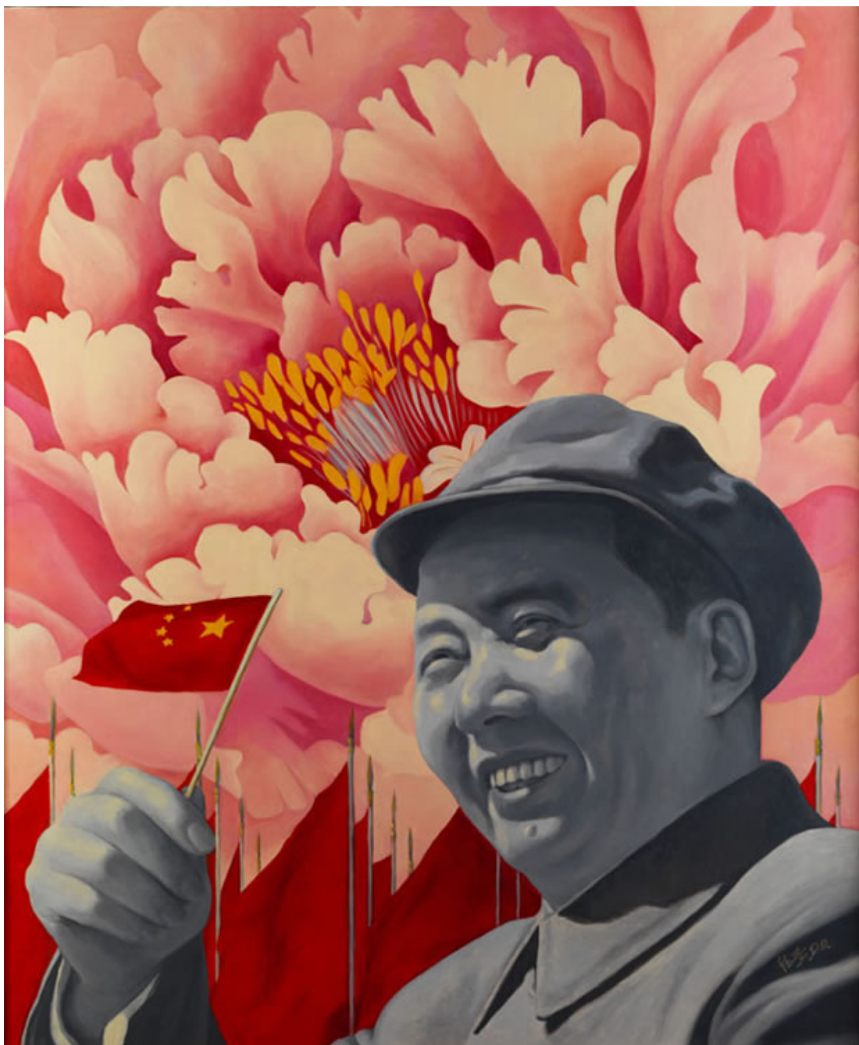
《中国花》许德奇（中国）作于2007年

那么，我们该何去何从？美国杜克大学教授高柏在《去美元化的下一步，金砖货币作为国际金融体系的未来》一文中也认为，迫切需要打破美元—华尔街体系，但目前还没有一条简单的前进之路。本币结算已经扩大（如俄罗斯和中国，俄罗斯和印度）但这种双边安排并不够。世界黄金协会（World Gold Council）最近的一份报告表明，全球央行越来越多地增加黄金储备，从而推高了黄金价格（黄金现货价格超过每盎司2300美元，远高于2015年每盎司1200美元左右的价格）。高柏认为，如果没有