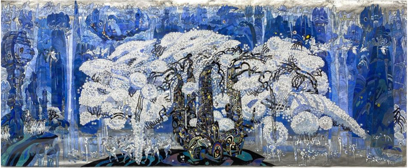
《石林》蒋铁峰（中国）作于1979年