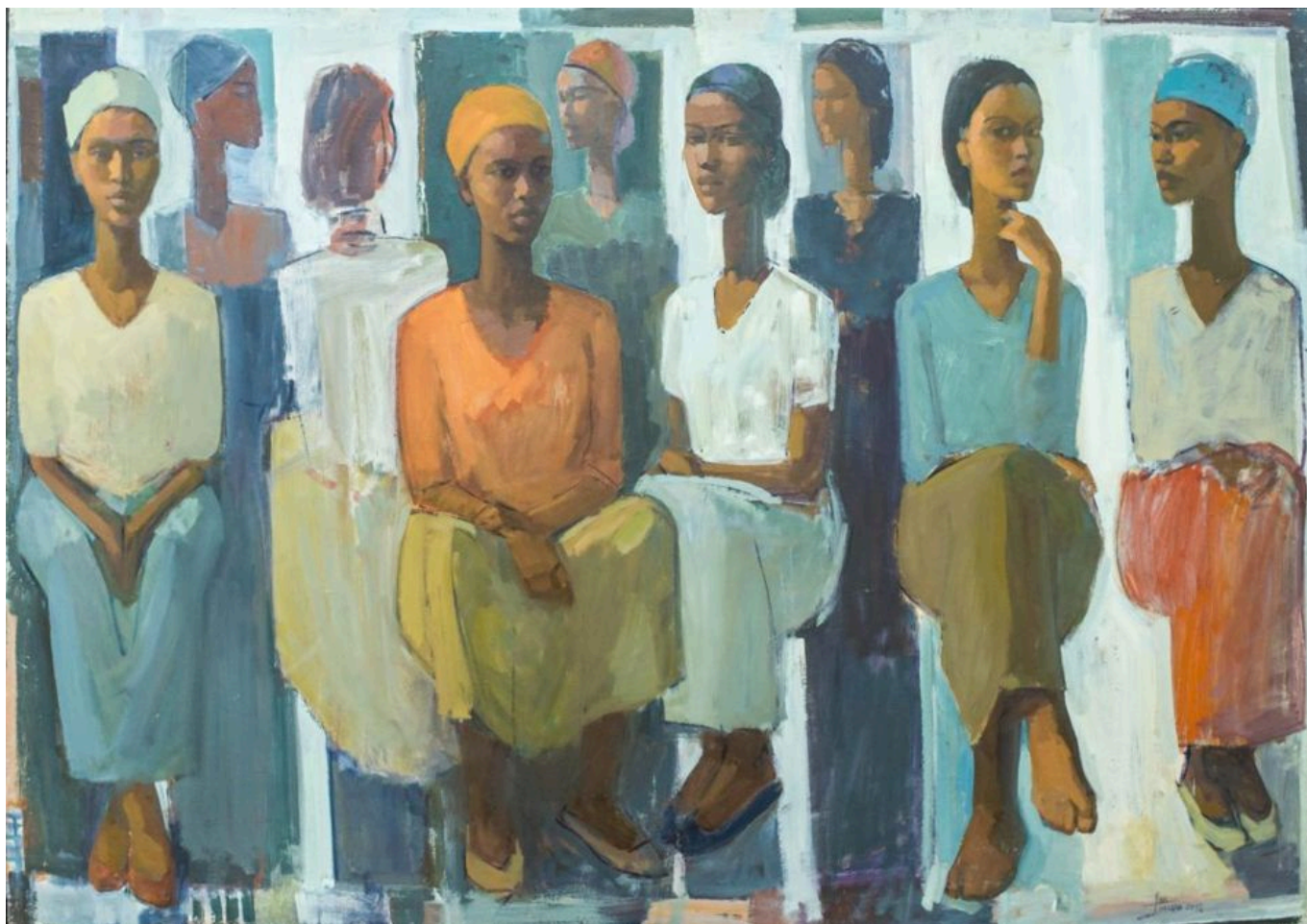
《生命的支柱：集市日》塔德塞·梅斯芬（埃塞俄比亚）作于2018年

深蒂固的腐败现象。” 然而，富国把腐败的概念用作攻击穷国的大棒，而丝毫不反省其自身的内部化交易成本（企业的巨额政治献金、政府职位和私企工作之间的旋转门现象常常成为公开贿赂的替代）。明年，我们将就公共机构廉洁的讨论发布 评估 文章。