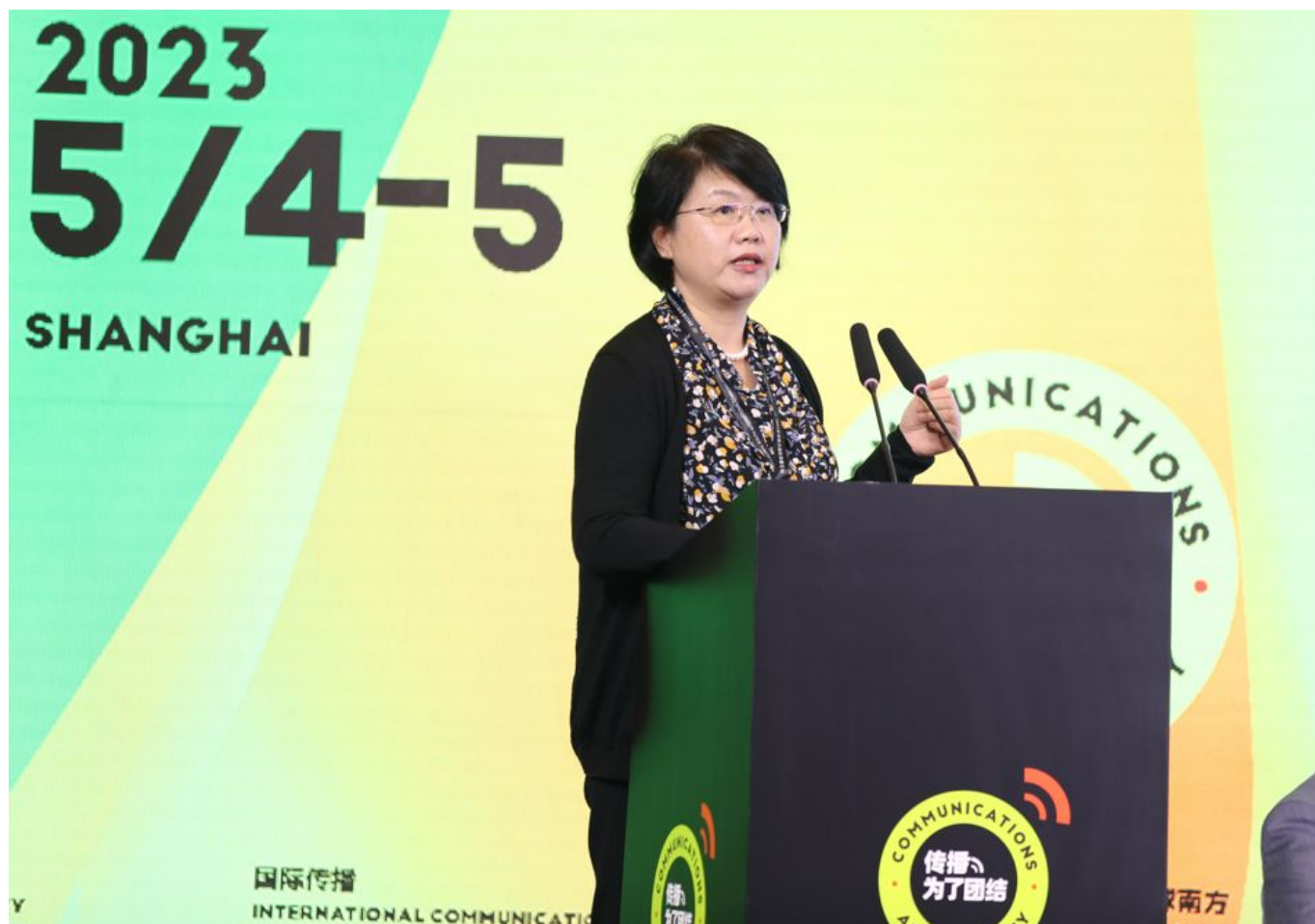
2023年5月5日，华东师范大学国际传播研究院院长吕新雨教授作全球南方国际传播论坛闭幕辞

我们注意到，本应为人类福祉服务的互联网、大数据、人工智能等数字技术被少数西方内容生产巨头和垄断平台用于主宰信息的制造和传播，并封锁与其霸权主张不同的声音。